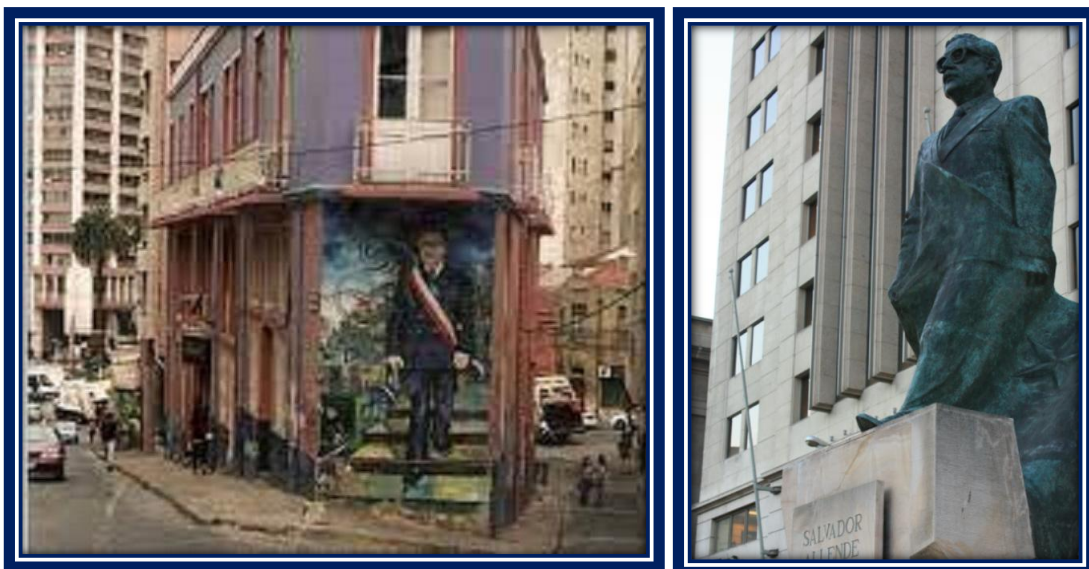
Mural en Valparaíso y Monumento en Santiago de Chile

Tras el retorno a la democracia y la reapertura del Congreso Nacional, por Ley N° 19.311, publicada el 11 de julio de 1994, se autorizó la erección de tres monumentos en su memoria, uno en Valparaíso, otro en Santiago y uno Punta Arenas.