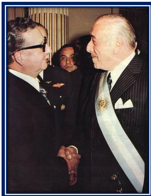
Salvador Allende y Héctor Cámpora 3

En julio de 1971, visitó Salta en la República Argentina y entre agosto y septiembre, estuvo en Colombia, Ecuador y Perú. Entre noviembre y diciembre de 1972, realizó una gira a México, a Estados Unidos, a la Unión de Repúblicas Socialistas Soviéticas (URSS) y a Cuba. En mayo de 1973, asistió a la asunción del mando del presidente Héctor José Cámpora en Argentina.