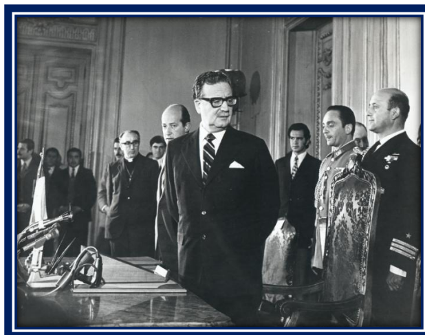
Salvador Allende, Presidente de Chile

Logró el triunfo definitivo gracias a la intervención de la Democracia Cristiana, que tenía la mayoría en el Parlamento. Este partido acordó apoyarlo siempre y cuando el electo presidente y los partidos representantes de su candidatura aceptaran la firma de un Estatuto de Garantías Democráticas, incorporado a la Constitución Política mediante una reforma. Una vez aceptada esta condición, el 24 de octubre de 1970, el Congreso Pleno lo proclamó presidente de Chile, con 153 sufragios, contra 35 de Alessandri y 7 en blanco.