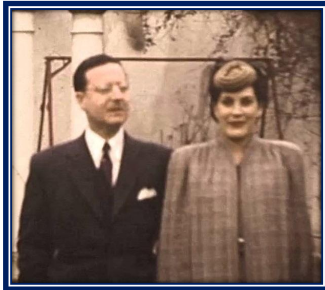
Salvador Allende y su esposa Hortensia Bussi Soto

En 1940, se casó con Hortensia Bussi Soto. Fue padre de tres hijas: Carmen Paz, Beatriz, secretaria de despacho durante su presidencia, e Isabel, senadora socialista.