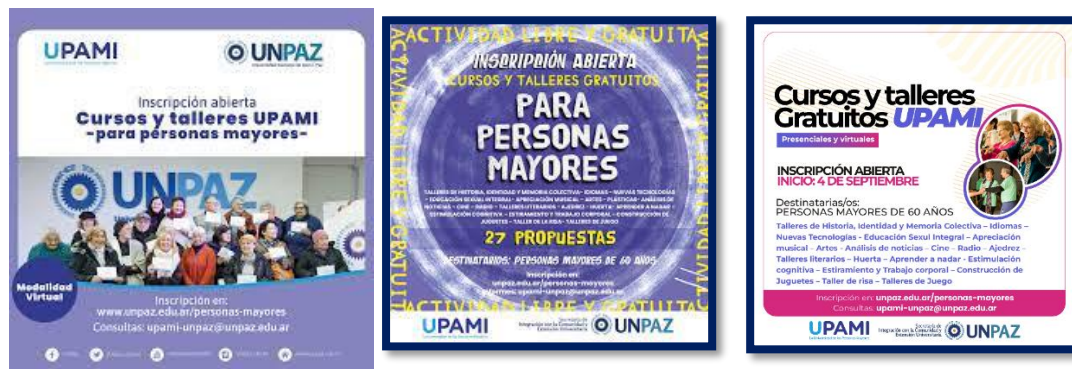
Cursos de UPAMI-UNPAZ 2021, 2022 y 2023

La diversidad de cursos que se ofrecen está vinculada con la ampliación de universos culturales, la recreación de los saberes y experiencias personales y comunitarias, el cuidado del bienestar y de los vínculos sociales y afectivos, la calidad de vida y la promoción de los derechos de las personas mayores.