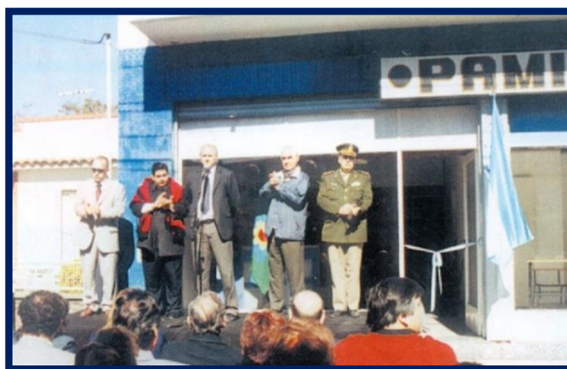
Agencia de PAMI en José C. Paz

El 8 de septiembre de 2004 , el Intendente Municipal de José C. Paz y el Director Ejecutivo del Programa de Atención Médica Integral para Jubilados y Pensionados (PAMI) de la Unidad de Gestión Local (U.G.L.) VIII, inauguraron la Agencia de José C. Paz para la atención de los afiliados a la obra social de Jubilados y Pensionados residentes en el Municipio paceño.