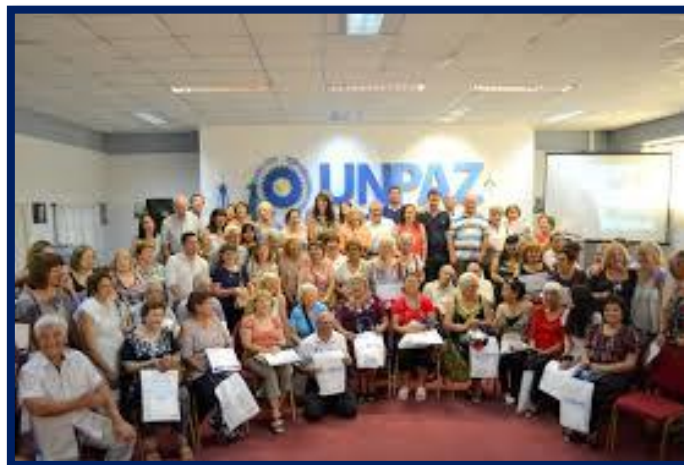
Cierre de cursos y talleres UPAMI-UNPAZ 2017

Al finalizar el año 2017, la UNPAZ bajo el título “Se realizó la entrega de certificados a participantes de los talleres UPAMI” 6 , informaba que: