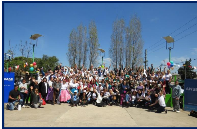
2018: Celebración del Día del Jubilado