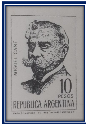
Estampilla editada en 1966 – Serie “Escritores Argentinos”

industrial que lo acompaña había tenido consecuencias poco deseadas para la dirigencia política y económica. El proceso de inmigración y de concentración de importantes masas de trabajadores en los centros urbanos derivó en la organización de éstos, y en la difusión de las ideas anarquistas y socialistas que se venían difundiendo desde hacía décadas en los países de Europa. Una primera respuesta desde el Estado a este nuevo fenómeno fue la represión de la protesta social. Por otro lado Miguel Cané, influenciado por las ideas liberales, y al calor de las corrientes más modernas del pensamiento universal, es un luchador desde la prensa y el Parlamento por la legislación laica, la educación común y la separación de la Iglesia y del Estado.