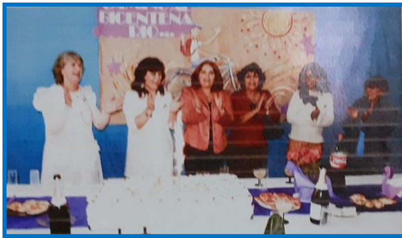
1984 – 2009: Festejo “25° Aniversario” de la Escuela Primaria N° 31