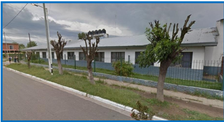
Escuela Primaria N° 31, ex Escuela N° 98 de General Sarmiento

En el plano de dicho loteo, la manzana “110a”, delimitada por las calles San Blas, Canal de Panamá, Caracas y Bolívar, actualmente Natalio Salvatori, está señalizada como “plaza”. En una fracción de dicha manzana, en la intersección de las calles Canal de Panamá y San Blas, mediante el Plan Sarmiento se comenzó a construir un edificio escolar, el que será destinado por la Dirección General de Escuelas de la Provincia de Buenos Aires a la Escuela Primaria N° 98 del Partido de General Sarmiento, actual Escuela Primaria N° 31 de José C. Paz, creada el 4 de octubre de 1984.