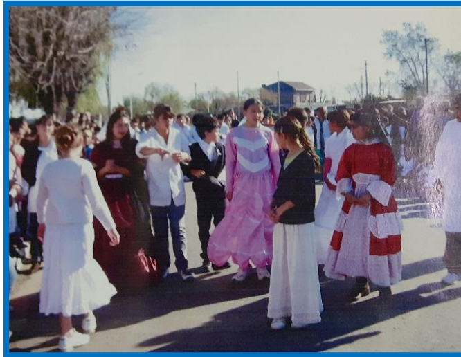
2010: Acto del Bicentenario sobre la calle Canal de Panamá