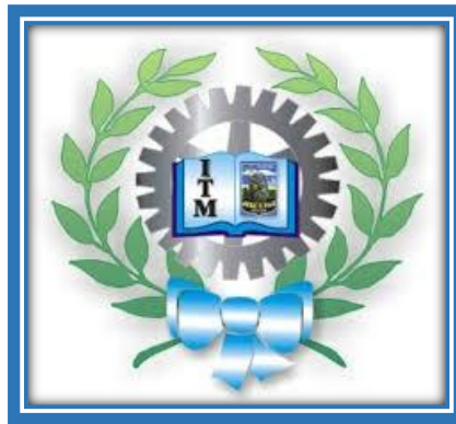
Logo del Instituto Tecnológico Municipal

Al observar la revista publicada por la Municipalidad de José C. Paz, donde se presenta la gestión del Intendente Mario Alberto Ishii en el decenio 1999-2009, sobre el Instituto Tecnológico Municipal encontramos: “Esta prestigiosa entidad fue creada con el esfuerzo de todos los municipales en plena crisis del año 2001. Forma parte integral del Centro Municipal de Estudios” 1 . En 2009 se cursaban seis tecnicaturas superiores: “en Automatización, Control y Robótica” , “en Gestión de Mantenimiento de Instituciones de Salud” ; “en Análisis de Sistemas” , “en Tecnología de alimentos” ; “en gestión Ambiental” y “en Química en Polímeros” .