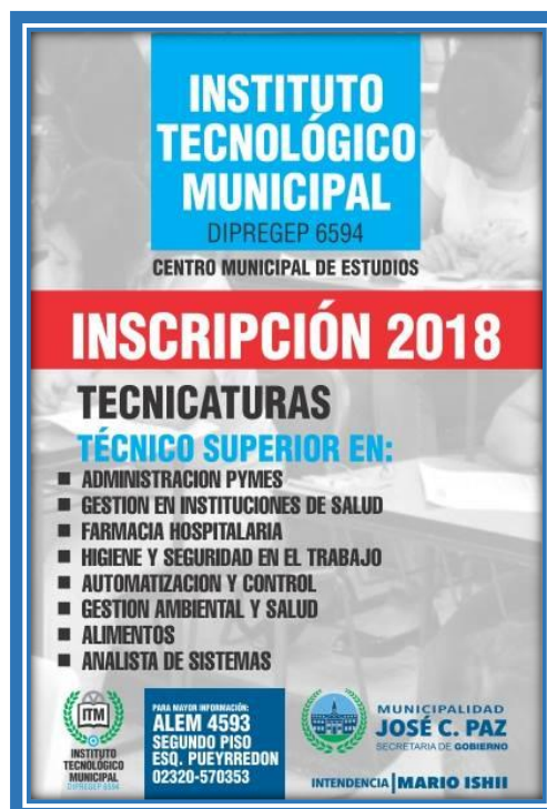
Folleto promocionando la inscripción para el 2018

“En la actualidad la oferta académica del ITM, está integrado por las siguientes carreras: Tecnicatura Superior en Análisis de Sistemas; Tecnicatura Superior en Gestión Ambiental y Salud; Tecnicatura Superior en Automatización y Control; Tecnicatura Superior en Alimentos; Tecnicatura Superior en Enfermería; Tecnicatura Superior en Higiene y Seguridad en el Trabajo y Tecnicatura Superior en Salud con especialidad en Farmacia Hospitalaria”.