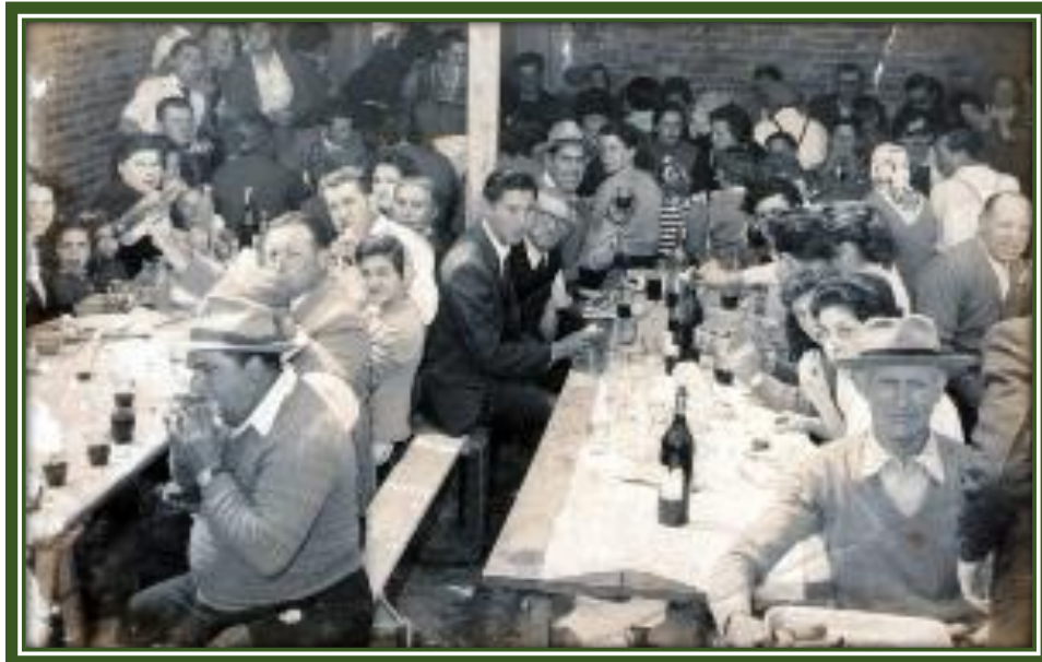
Tradicional almuerzo de la comunidad portuguesa

El artículo informa que ese día se practicaron diversos deportes, al mediodía se sirvió un “asado criollo” , culminando los festejos con una “velada danzante” .