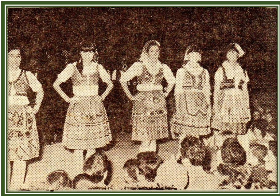
Jóvenes de Círculo Cultural Portugués con sus trajes típicos

Por la tarde “La numerosa concurrencia que se había congregado en el lugar tuvo ocasión de presenciar y gustar de interesante expresiones de colorido y vivacidad ofrecidas por las actuaciones de conjuntos folklóricos de colectividades radicadas en la zona, tales como el Círculo Cultural Portugués Nuestra Señora de Fátima, la Sociedad Polaca Poznan y la Colectividad Japonesa, quienes con sus canciones y bailes típicos, que tuvieron luego, la expresión criolla de la peña Pancho Ramírez del Club El Porvenir, depararon una nota de singular encanto...” .