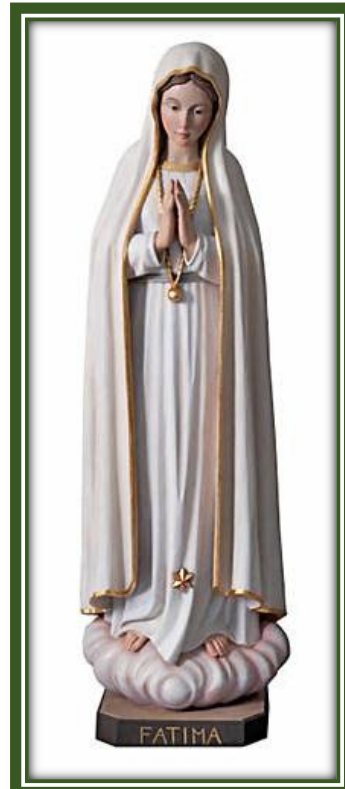
Imagen de Fátima

rojo, azul, morado... Todos tienen la sensación que el sol se desprende del firmamento y, a pequeños saltos, a derecha e izquierda, parece precipitarse sobre ellos, irradiando un calor cada vez más intenso” 5 .