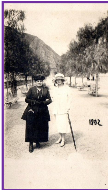
De paseo por Cacheuta con su hija

En cuanto a su vida familiar continuó los miércoles como día de visita y con sus hijas solía hacer sus paseos de vacaciones o veraneo. Algún año visitó Mar del Plata o también a las termas de Cacheuta, en Mendoza.