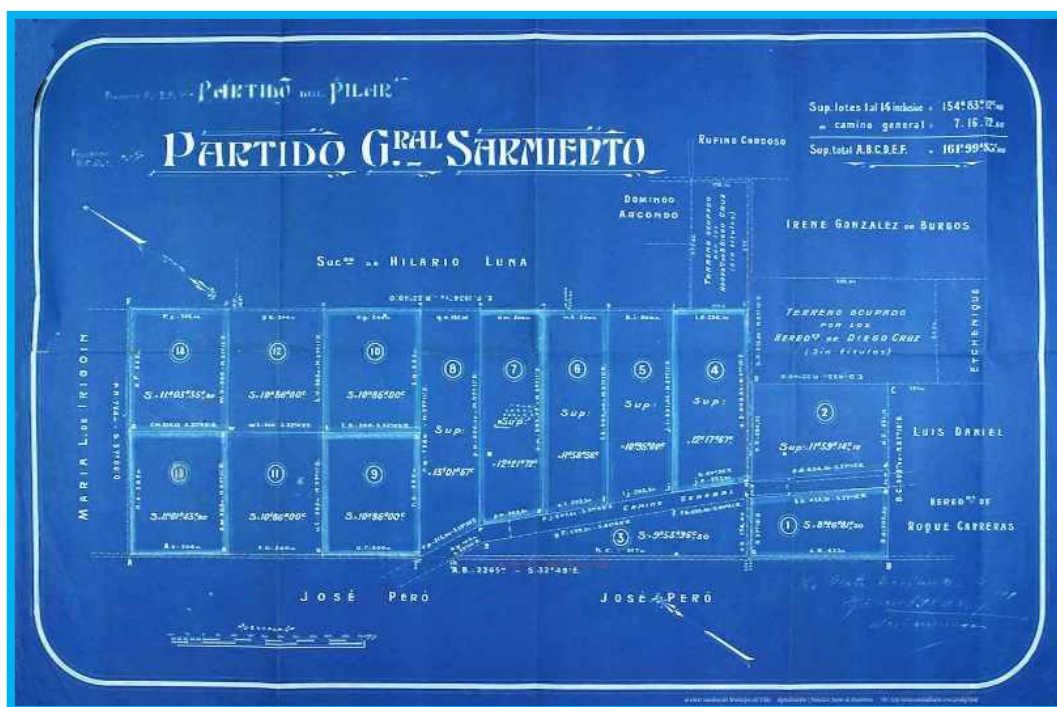
Subdivisión del campo de Diego Cruz entre sus herederos

Al trasladarse la Escuela N° 9 a Bella Vista, los alumnos debieron seguir sus estudios primarios en la Escuela N° 5, actual EP N°2, en Villa Altube, y a partir del 1º de abril de 1911 con la Escuela N° 4, actual EP N° 1 en Villa Iglesias, ambos barrios en Arroyo Pinazo, actual José C. Paz