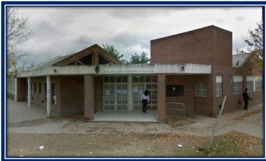
Jardín de Infantes N° 909

La reseña histórica institucional expresa que el Jardín N° 908 “abre sus puertas a una comunidad con muchas carencias económicas, sociales y por sobre todo afectivas. El comedor escolar es el único sustento diario para 220 niños con necesidades básicas insatisfechas. Existe en la zona un alto grado de desnutrición infantil, tanto al momento de su creación como ahora” 4 (2010).