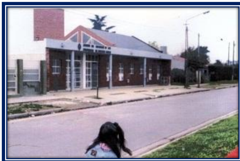
Jardín de Infantes N° 911

El Jardín de Infantes N° 911 , ubicado en la calle Acerboni N° 544 del Barrio El Ombú, “comenzó a funcionar el 23 de marzo de 1998, con una reunión dirigida a padres de todo el Jardín divididos en dos turnos. El objeto fue conocernos, informar, aliviar tensiones, evacuar todo tipo de dudas y presentar el personal directivo y docente (el personal auxiliar todavía no había sido designado). Luego de una charla general cada docente en su sala organizó una reunión de padres de la sección correspondiente. El Tema: Período inicial . Las clases comenzaron el lunes 26 de marzo de 1998... 6 .”