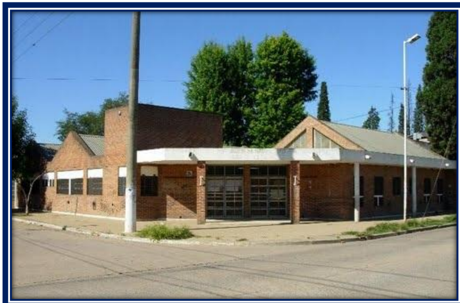
Jardín de Infantes N° 908

El Jardín de Infantes N° 908 , ubicado en la esquina de las calles Ugarteche y Laprida en el Barrio Frino, vecino al Barrio Alberdi; construido en la misma manzana que la EGB N° 21.