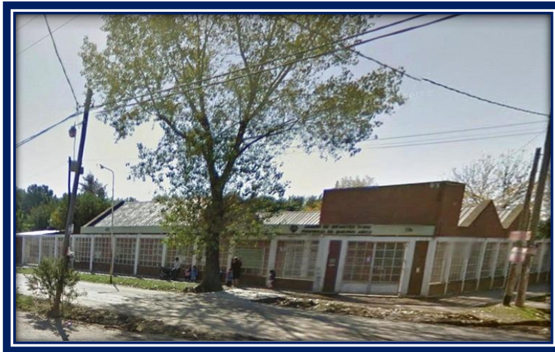
Jardín de Infantes N° 910

El Jardín de Infantes N° 911 , ubicado en la calle Acerboni N° 544 del Barrio El Ombú, “comenzó a funcionar el 23 de marzo de 1998, con una reunión dirigida a padres de todo el Jardín divididos en dos turnos. El objeto fue conocernos, informar, aliviar tensiones, evacuar todo tipo de dudas y presentar el personal directivo y docente (el personal auxiliar todavía no había sido designado). Luego de una charla general cada docente en su sala organizó una reunión de padres de la sección correspondiente. El Tema: Período inicial . Las clases comenzaron el lunes 26 de marzo de 1998... 6 .”