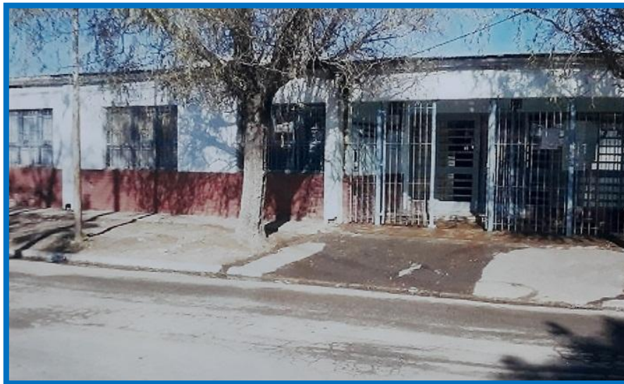
Escuela N° 52 en Mendoza y Tres Sargentos, B° 9 de Julio