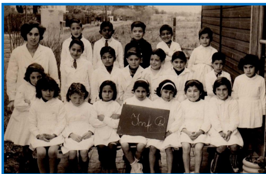
Primer Grado Inferior en los inicios de la Escuela

El intendente Dasso poseía unos terrenos casi lindantes con la localidad de José C. Paz, enterado de los fines los donó al efecto y los vecinos se pusieron en movimiento: serrucho en mano, clavos y martillo, día a día, especialmente los fines de semana, fueron levantando dos aulas de madera con techo de chapa.