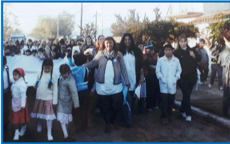
Alumnos y docentes portando la Bandera en los actos del Bicentenario