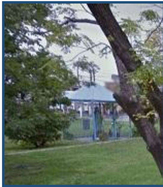
Plaza “Virgen Nuestra Señora del Rosario de San Nicolás

El 9 de diciembre de 1999, se trajo la imagen en un camión y se la colocó sobre el pedestal. Se pusieron las rejas y el toldo. La Delegación Municipal del barrio 9 de Julio, cercó el terreno de la plaza con palmeras y construyó mesas y bancos. Los comerciantes donaron plantas florales y árboles para ornamentarla.