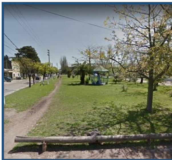
Vista de la Plaza “Virgen Nuestra Señora del Rosario de San Nicolás”