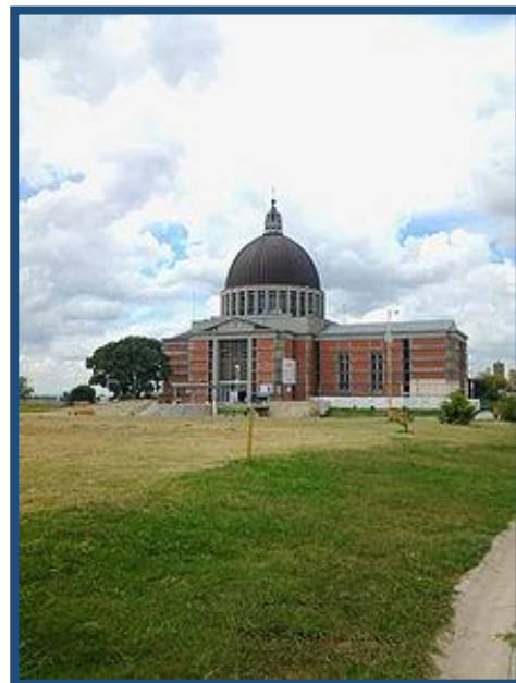
Imagen y Santuario de la Virgen Nuestra Señora del Rosario en la ciudad de San Nicolás de los Arroyos