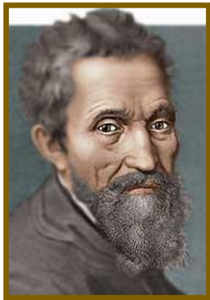
Miguel Ángel Buonarroti 3

Pese a que el padre consideraba que el arte no era una actividad digna de su posición social, Miguel Ángel entró en 1488 como aprendiz en el taller de Ghirlandaio, donde aprendió el arte de pintar y el dominio de la técnica del fresco. Completó su formación con el escultor Bertoldo di Giovanni, que había sido discípulo de Donatello. Gracias a él penetró en el círculo de los Médicis. Según cuenta su biógrafo Condivi, un día estaba el aprendiz copiando en un trozo de mármol la cabeza de un fauno antiguo que había en el jardín de la Villa Médici, cuando Lorenzo el Magnífico acertó a pasar por allí. Admirado de la perfección con la que el joven había sabido modelar la cabeza, decidió tomarlo bajo su protección. De esta manera, Miguel Ángel entró a formar parte del grupo de artistas e intelectuales más avanzados de su época. Con ellos aprendió el humanismo neoplatónico que guiaría su pensamiento y su obra hasta el final de su vida.