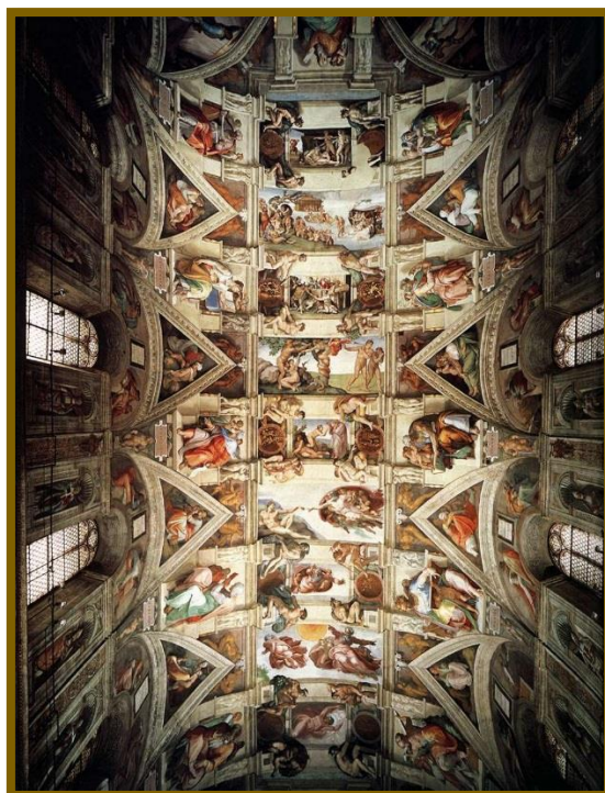
Bóveda de la Capilla Sixtina (Ciudad del Vaticano) 5

El resultado constituye una de las más altas cumbres no sólo del renacimiento clásico sino de la pintura de todos los tiempos. En la bóveda, compartimentada en cinco áreas rectangulares centrales y varios rectángulos y lunetos, se desarrollan las historias del Antiguo Testamento que anuncian la llegada de Cristo, desde la creación del hombre.