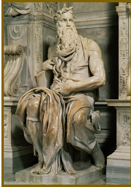
1515: “Moisés” (Iglesia de San Pedro ad Vincula – Roma, Italia) 8