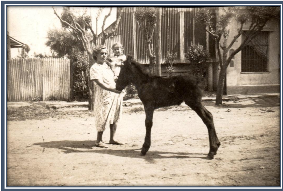
Calle Mitre, lado Oeste (Villa Iglesias)