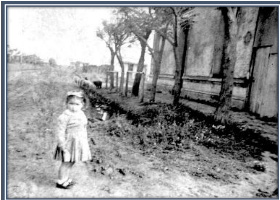
Se aprecia en la Esquina de Derqui y Colón, lado Oeste (Villa Altube), la necesidad de construir pasos de piedra