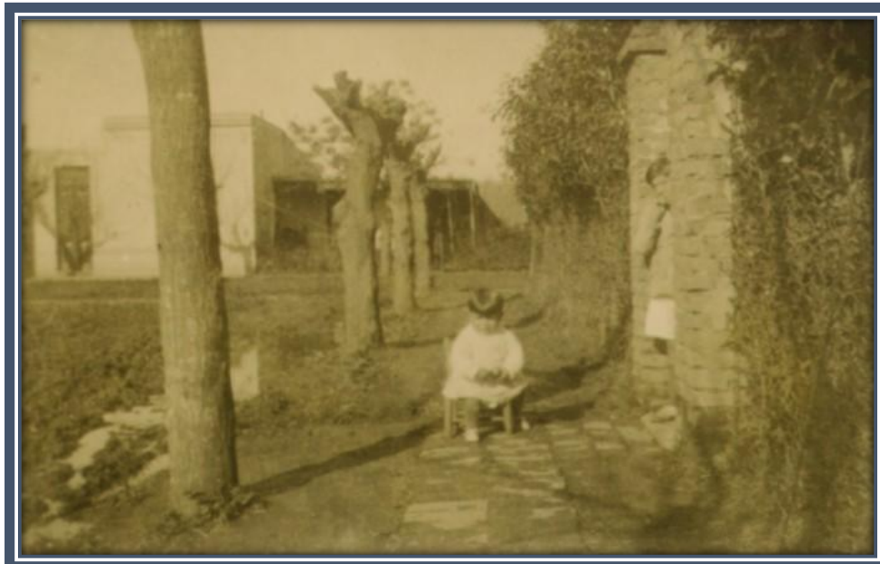
Vereda de ladrillo del lado “este” (Villa Germano)