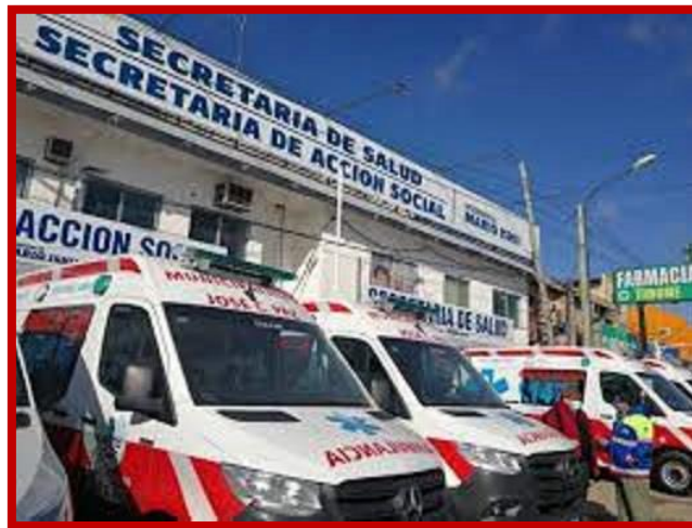
2020: 10 Ambulancias nuevas