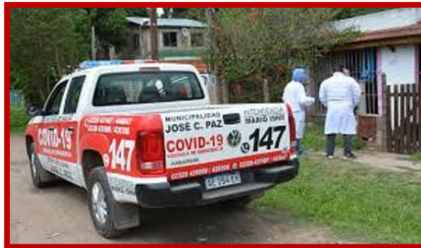
2020: 10 camionetas