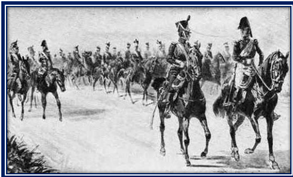
San Martín con sus granaderos en marcha hacia San Lorenzo 2

José María Rosa 1 nos relata lo sucedido antes y durante el Combate de San Lorenzo: “A mediados de enero de 1813, la escuadrilla española entró por la boca del Guazú: se componía de once embarcaciones armadas en guerra con 350 hombres entre marineros y soldados. El 28 salió San Martín con 125 granaderos escogidos –sólo una parte del regimiento–, observándola desde la costa.