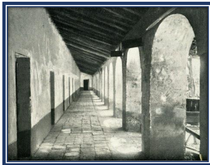
Claustro del Convento de San Carlos, donde se atendió a los granaderos heridos en combate 6

“Un dato interesante aunque no resuelve el tema numérico planteado, surge de una nota remitida por el doctor Argerich el día 26.Feb.1813 que dice: las carretillas y el coche me parecen saldrán dentro de muy pocos días para esa con la mayor parte de los enfermos, sólo permanecerán aquí siete de los de mayor gravedad”. De acuerdo a la nota Argerich, los heridos deberían ser más de 14, ya que quedaban solo “siete de los de mayor gravedad” y que “las carretillas y el coche saldrán... con la mayor parte de los enfermos”. Agregando Colimodio y Romay, con referencia a los que quedaron en el convento: “Casi con certeza podemos determinar que los 7 mencionados son Díaz Vélez y los 6 dados de baja posteriormente por inválidos”.