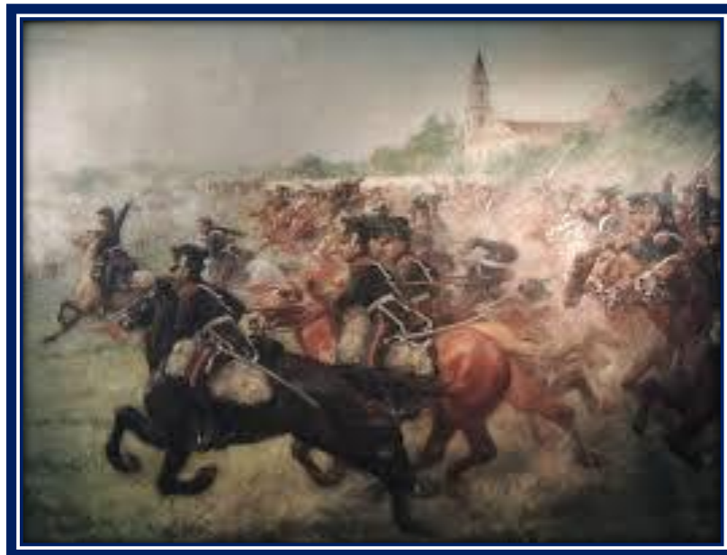
Óleo “Combate de San Lorenzo” de Pedro Subercaseaux (1909)

sus dos cañones, 50 fusiles, 40 muertos y 14 prisioneros. Los granaderos tuvieron 27 heridos y 15 muertos, entre ellos el Capitán Bermúdez”.