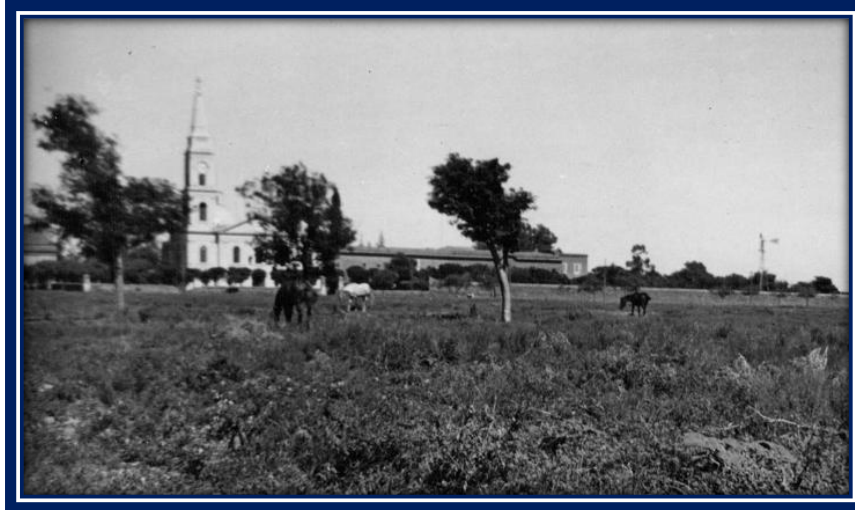
Convento de San Carlos 3

presurosamente al interior. Estaban en el convento, cuando vieron la polvareda de la milicia de escalada por el camino a Rosario. No sabiendo su número prefirieron reembarcarse. Escalada hizo desde el convento algunos disparos con su cañoncito contra los buques, contestado por éstos”.