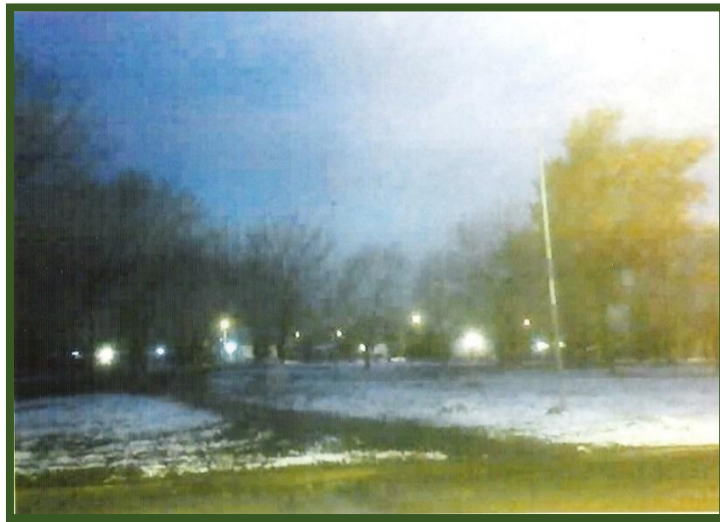
Plaza del Barrio de José C. Paz el 10 de junio de 2007

El loteo carecía de todo tipo de servicios y los vecinos prontamente formaron la Unión Vecinal que comenzó a trabajar para el progreso del barrio: traer la luz eléctrica, hacer las veredas, los pasos en las esquinas, el refugio en la parada de colectivos en la ruta, la escuela, la estafeta postal... 3 .