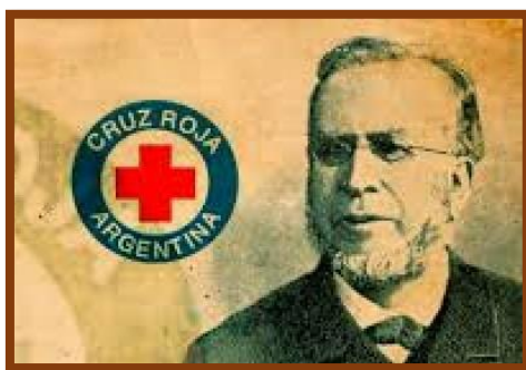
Dr. Guillermo Rawson 5

Durante 1880, proclamó su último discurso, durante la presidencia de don Nicolás Avellaneda. El 10 de junio de ese mismo año, fundó en Buenos Aires la “Cruz Roja Argentina”. Al año siguiente, realizó un viaje rumbo a Europa, con la finalidad de descansar y de hacerse atender de una enfermedad en la vista.