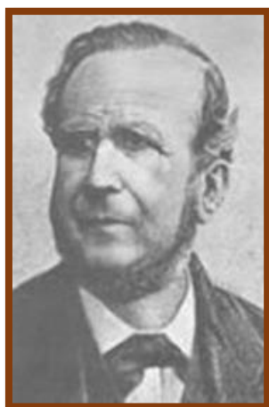
Dr. Guillermo Rawson 4

más tarde, ordenó el inicio de la construcción del ferrocarril que iría desde Rosario hasta Córdoba. Fue él quien impuso la línea telegráfica subfluvial desde Buenos Aires hasta Montevideo. Entre 1867 y 1868, colaboró durante la epidemia de cólera. A principios de 1868, renunció a su cargo de ministro, debido a su objeción a los “gobiernos electores”, y como expresión de respeto a la voluntad popular. Dedicó mucho esfuerzo para atender a los problemas interiores que determinaban la guerra internacional y las luchas fratricidas. Un año más tarde, se realizó el Primer Censo Nacional, idea que él propusiera durante el tiempo en que fue ministro de Mitre.