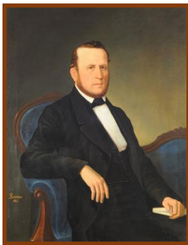
Retrato al óleo de Guillermo Rawson pintado por su hermano Benjamín Franklin Rojo 3

En 1854, expuso su opinión sobre la navegación aérea. Explicó que era conveniente la utilización de aparatos más pesados que el aire e imitando a las aves y que no era recomendable experimentar con globos, tal como se habían usado en aquella época. En el transcurso de ese mismo año, fue electo Diputado al Congreso de Paraná, pero asumió su banca el 1° de mayo de 1856. Como Diputado, ocupó la vicepresidencia de la Cámara. Fue opositor a la política de Urquiza. Durante su trabajo parlamentario, defendió el proyecto de comercio libre con Buenos Aires y participó en debates sobre otros problemas económicos e institucionales.