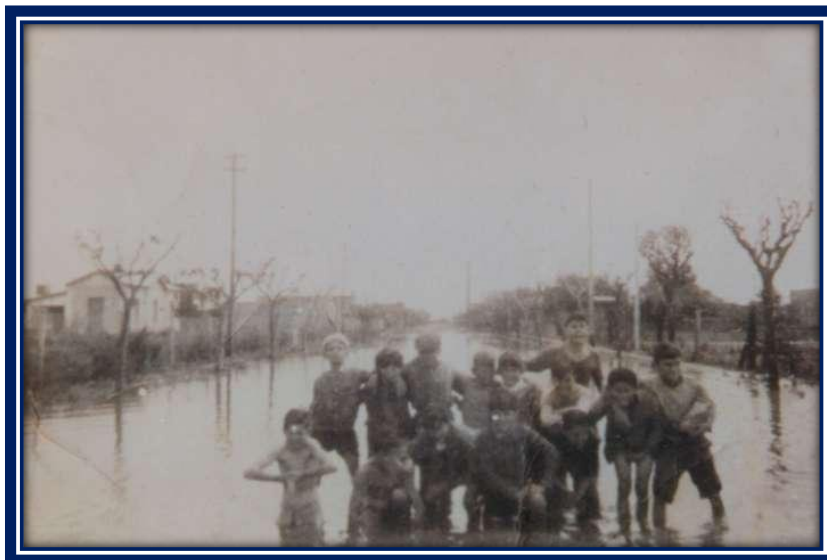
La población quedaba aislada cuando se producía el desborde del arroyo Claro, problemática que subsistió por muchos años

La Asociación de Fomento del Pueblo Pinazo asumió la representatividad de vecindario y la prosecución de los fines para la que fue creada. La tarea fue ardua, ya que con las lluvias los caminos se tornaban intransitables, además para poder acceder a la estación, los vecinos no tenían veredas, tengamos en cuenta que el loteo comenzaba a 600 metros de la estación, cruzando el Arroyo Claro. En cuanto al embellecimiento y mejoras edilicias, contaban con la plaza Centenario, que era una manzana pelada en el medio del loteo, con la Escuela Primaria N° 1 (entonces Escuela N° 4 de General Sarmiento), que también en época de lluvia se hacía difícil su acceso. Eran todas calles de tierra, las viviendas iban surgiendo con la radicación de nuevos vecinos, pero carecían de los servicios públicos básicos, de ahí la importancia de la Asociación de Fomento para hacer las gestiones necesarias para dar respuesta a las distintas problemáticas.