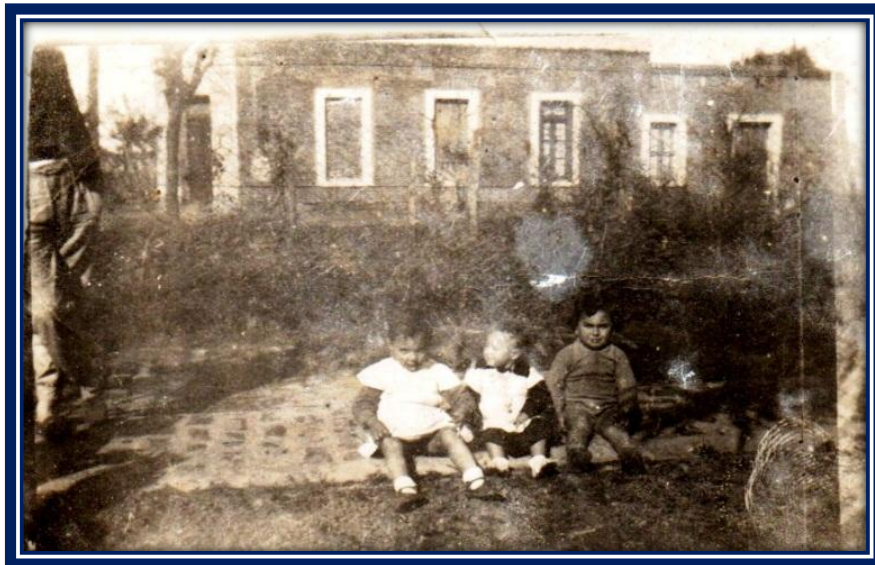
Vista de “Villa Iglesias”

Meses después de estos actos desapareció la Asociación de Fomento de Pueblo Pinazo y, el 9 de marzo de 1914, surgió una nueva institución: la Sociedad de Fomento de Villa Iglesias.