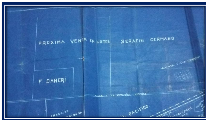
Plano trazado por Ambrosio Acerboni

Por el nombre de la plaza y la apertura de la escuela podemos afirmar que ya había familias asentadas desde 1910, incluso viviendas edificadas como la que se alquila para que funcione la escuela.