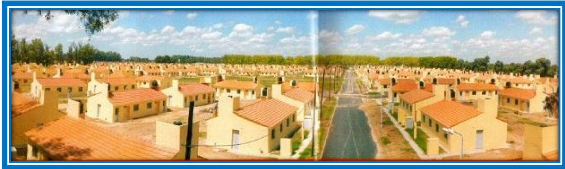
Vista del Barrio “Dr. René Favaloro” 4

El 10 de abril de 2007, por medio del Decreto N° 508/07, el Ejecutivo Municipal adjudicó las 1.122 viviendas emplazadas en predio ubicado en Av. Saavedra Lamas, “de acuerdo a los informes técnicos elaborados por los asistentes sociales que determinaron los beneficiarios de las mismas”. Se adjuntó al Decreto el listado de beneficiarios como Anexo I. Por Ordenanza N° 796/07, sancionada por el Concejo Deliberante el 11 de mayo siguiente, se homologó y ratificó en todos sus términos del Decreto N° 508/07; promulgada por el Ejecutivo Municipal el 21 de mayo de 2007, por medio del decreto 0701/07. El 30 de agosto de 2007, se modificó el Anexo I señalado, incorporando 23 beneficiarios, por medio del Decreto N° 1217/07, ratificándose la modificación por la Ordenanza N° 824/07 el 5 de octubre de 2007, promulgada por Decreto N° 1702/07 el 4 de diciembre de 2007.