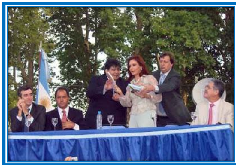
El Intendente entrega a la Presidenta el Escudo de José C. Paz y el libro “José C. Paz la Toponimia de sus calles”

Concluido el acto y después de saludar calurosamente a los presentes, la Presidenta acompañada por el Gobernador, el intendente y demás autoridades presentes recorrieron una de las viviendas inauguradas.