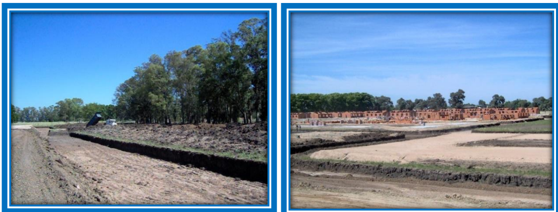
La obra avanzaba día a día

Inmediatamente comenzaron las obras, Patagonia Construcciones y MZ Argentina S. R. L., realizaron la excavación y retiro de suelo vegetal dentro del predio de espesor de 0,50 metros, la compactación de subrasante y perfilado, proveyeron y colocaron de capa de tosca; Prensadora Quilmes S. A. suministró hierro, alambre y clavos; Casa Fusco el cemento; Ramper S. A. piedra partida, arena y tosca, los primeros proveedores.