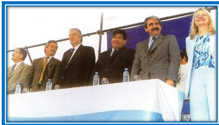
Visita a José C. Paz del Presidente Dr. Néstor Kirchner 2

En el año 2003, el presidente Néstor Kirchner implementó como política pública dar solución a los problemas habitacionales de los argentinos, por medio de la cual perseguía tres objetivos: la generación de empleo, la disminución del déficit habitacional y la reactivación de la economía local a partir de la movilización del mercado de la construcción. Estos objetivos fueron puestos en práctica por medio de diversos programas, conocidos como los Planes Federales de Vivienda 1 .