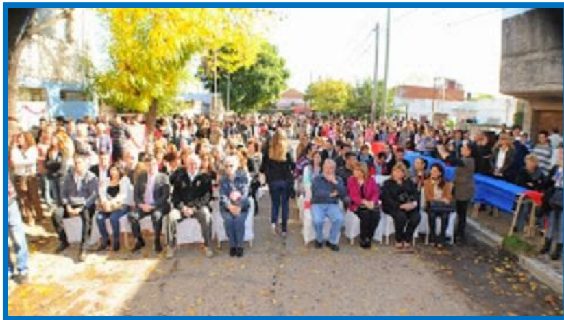
Acto del 40° Aniversario