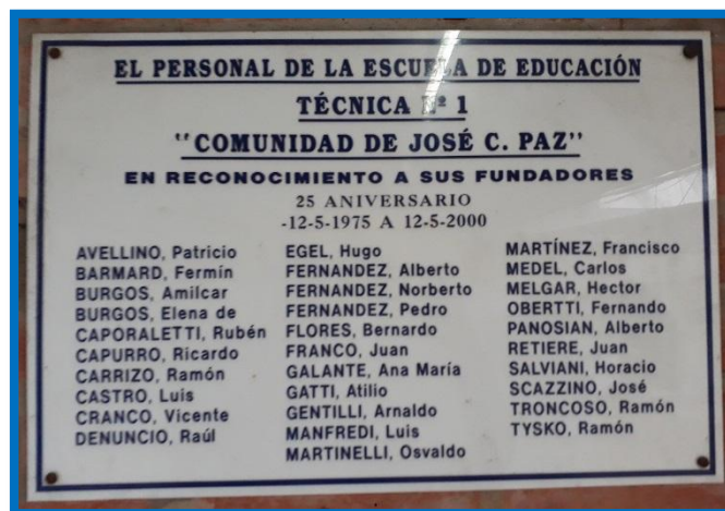
Reconocimiento del Personal de la Escuela a los “vecinos fundadores”