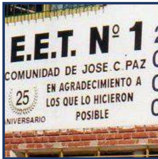
Año 2000: Homenaje al celebrar sus 25 años pintado en la pared del frente del Establecimiento

De este modo, al cumplir once años de su creación y del inicio de actividades, la Escuela de Educación Técnica N° 1, actual E.E.S.T. N° 1, se le impuso el nombre de “Comunidad de José C. Paz”.