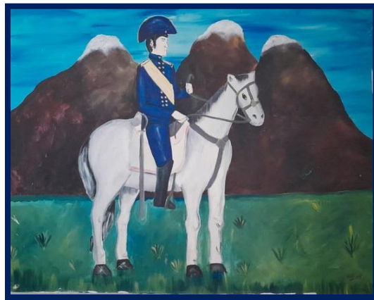
Mural del General José de San Martín en la Escuela Primaria N° 38

El 17 de agosto de 1850 fallecía en Boulogne-sur-Mer, Francia, el militar y político argentino Libertador de Argentina, Chile y Perú, General José de San Martín, quien había nacido en Yapeyú, provincia de Corrientes, el 25 de febrero de 1776, en cuyo homenaje se le impuso su nombre a la Escuela Primaria N° 38 del Barrio Sarmiento Norte, nombre que también llevan el Colegio e Instituto General José San Martín de las Hermanas Franciscanas en el Cruce de José C. Paz y el Instituto Libertador José de San Martín del Barrio Aguinaga.