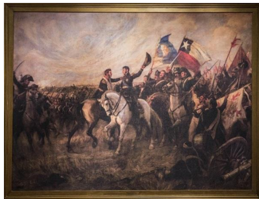
Abrazo de O'Higgins y San Martín en Maipú 3

La victoria de Maipú tuvo enorme importancia, no sólo militar sino también política, por su gran repercusión en todo el continente, llevando esperanzas a los pueblos aún dominados y causando a la vez halagüeños augurios por sus derivaciones en la política europea.