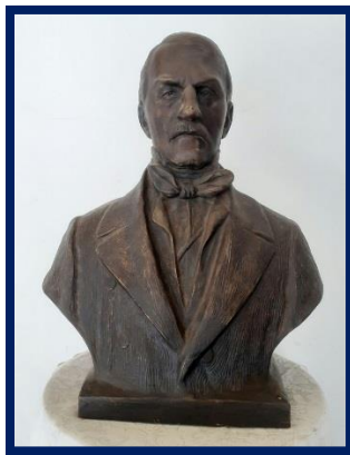
Busto de José Francisco de San Martín

Renunció a la gloria y envainó dignamente su corvo, que nunca fue usado para avasallar naciones. La posteridad, a quien San Martín confiaba el juicio de su vida y de sus acciones, lo proclama, como ha expresado el autor peruano Mariano Felipe Paz Soldán: "El más grande de los héroes, el más virtuoso de los hombres públicos, el más desinteresado patriota, el más humilde en su grandeza, y a quien el Perú, Chile y las Provincias Argentinas le deben su vida y su ser político".