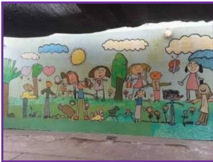
Mural pintado por docentes y alumnos del establecimiento escolar