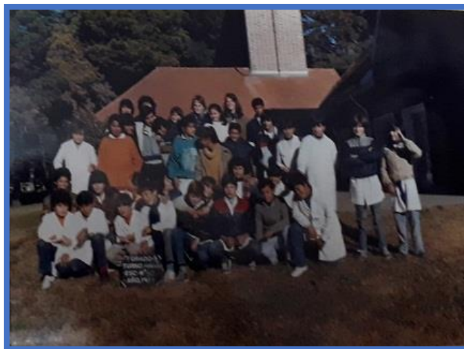
1986: Alumnos de 7º grado