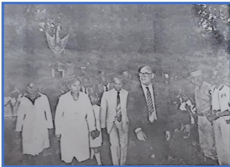
El gobernador Aguado recorriendo las instalaciones escolares

El 25 de febrero el gobernador Jorge Aguado y el intendente José Antonino Lombardo inauguraron seis edificios escolares de este plan, entre ellos el de la Escuela N° 90 en el barrio Parque Abascal, actual Escuela Primaria N° 27 2 .