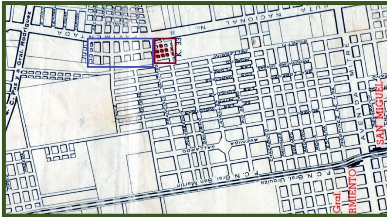
Señalizado en azul, la subdivisión de Ambrosio Spada de 1911 Señalizado en rojo, loteo del Parque “Tavella” de 1950