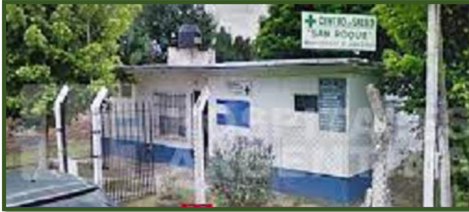
Centro Asistencial “San Roque”

Recorriendo el barrio, encontramos en la calle Pavón N° 3545, el Centro Asistencial “San Roque”, ya publicado en 1986 en la Guía editada por el Municipio de General Sarmiento.