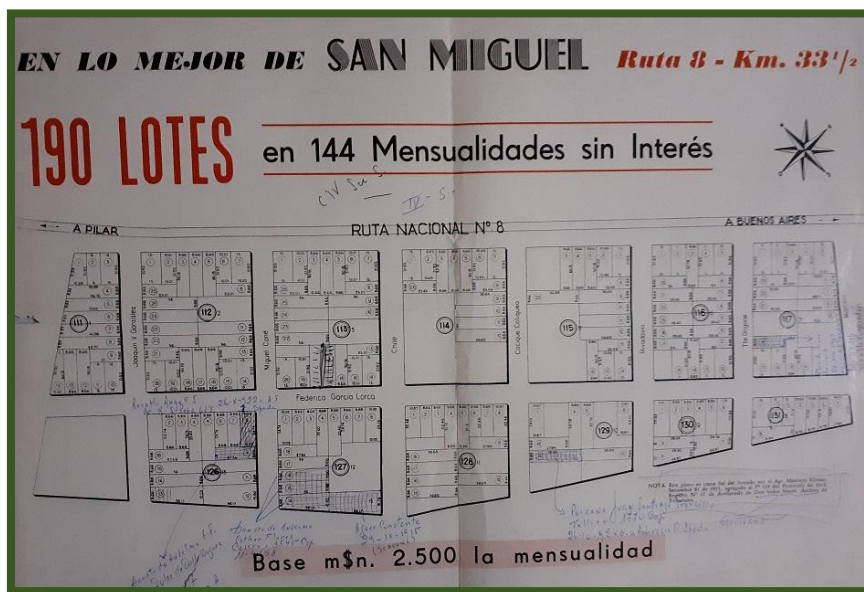
Plano de loteo del barrio “San Roque de la Ruta”

De los 190 lotes, 53 estaban distribuidos en las cuatro manzanas de San Miguel y 137 en las diez de José C. Paz y 53, encontrándose 14 parcelas en la manzana 111, anterior N° 1; 24 en la 112, ex N° 2; 21 en la 113, anterior N° 3; 13 en la N° 114, ex N° 4; 15 en la N° 115, anterior N° 5; 7 en la N° 129, ex N° 10; 14 en la 128, anterior N° 11; 14 en la N° 127, ex N° 12; y 15 en la N° 126, anterior N° 13.