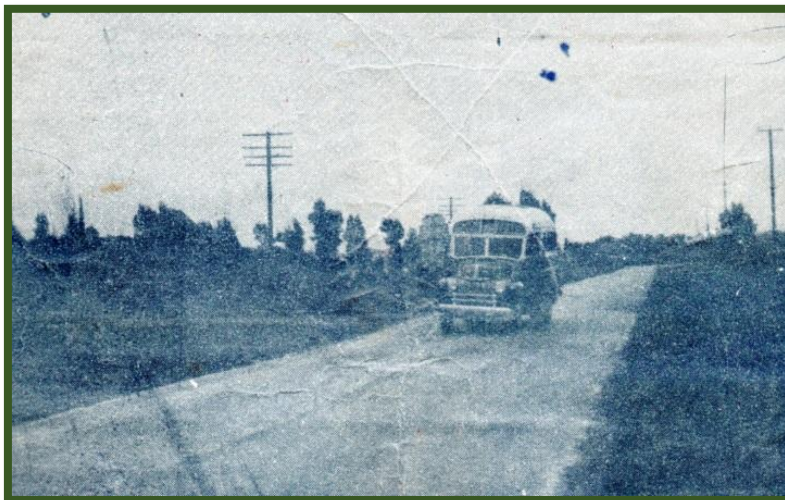
1950: Colectivo N° 175 circulando por el kilómetro N° 33 de la Ruta N° 8