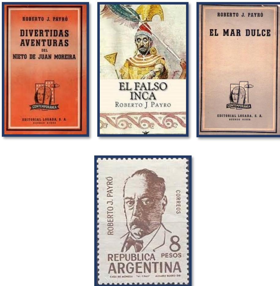
1965: Serie de sellos postales “Escritores Argentinos: Roberto J. Payró”

A Roberto J. Payró se lo considera, junto a los hermanos Podestá, uno de los creadores del teatro nacional. Entre sus obras teatrales escribió Marco Severi (1905), Vivir quiero contigo (1923) y Fuego en el rastrojo (1925), entre otras.