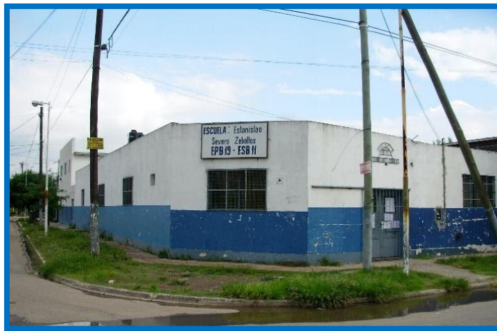
2011: Vista del edificio escolar de la EP Nº 19

Pasará más de un año y el 8 de agosto de 1983 comenzó a funcionar en el edificio la Escuela Nº 65 de General Sarmiento 5 , actual Escuela Primaria Nº 19 de José C. Paz.