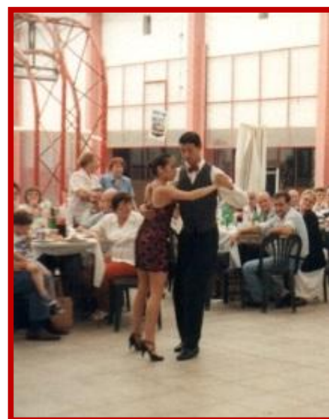
Cuerpos de baile del Club Atlético “El Porvenir”