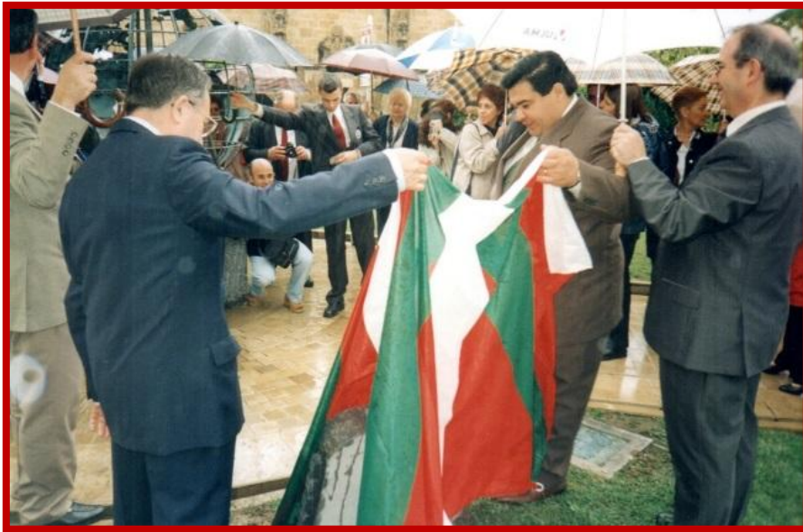
Descubriendo el Escudo de José C. Paz en el monumento de los Hermanamientos