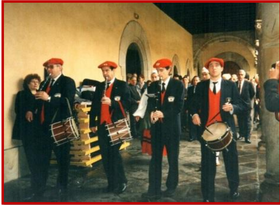
Oñatierras agasajando a la delegación de José C. Paz

Oñati, con el cual se dio por finalizado los actos programados por el Hermanamiento entre ambos municipios.