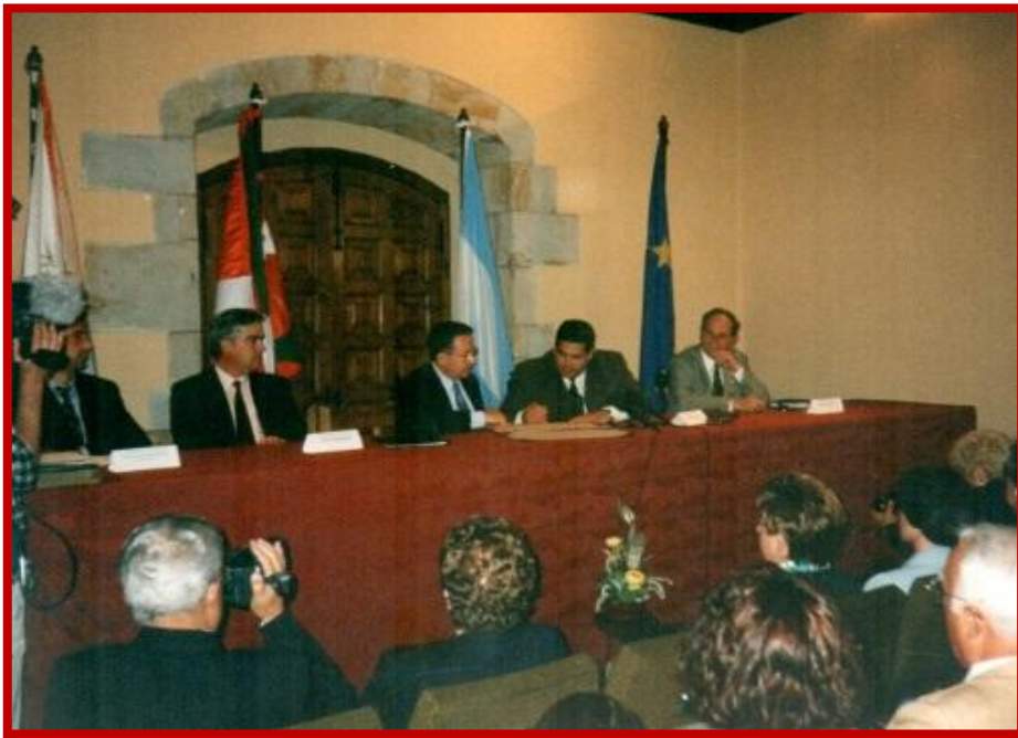
El alcalde de Oñati y el intendente de José C. Paz firmando el Acta de Hermanamiento

Dado en la Muy Noble y leal Villa de Oñati, a quince de julio de dos mil”.