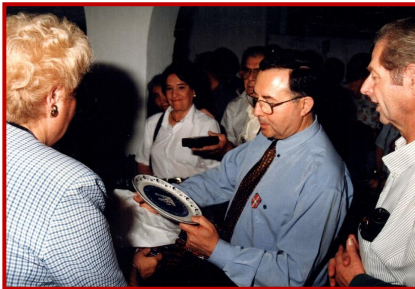
La directora del Coro Polifónico entregando un obsequio al Alcalde