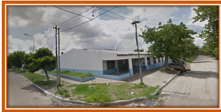
Edificio escolar de la Escuela de Educación Secundaria Nº 4 donde funcionó la Escuela Nº 92 de General Sarmiento entre 1983 y 1994