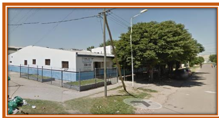
Escuela Primaria Nº 28, ex Escuela Nº 91 de General Sarmiento