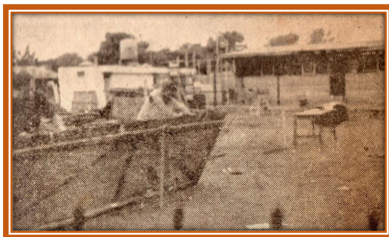
Primitivo edificio de la Escuela N° 52 de General Sarmiento

De acuerdo a lo proyectado en el Plan Sarmiento, un edificio estaba destinado a la enseñanza primaria y otro a la enseñanza secundaria. Pero las necesidades de la zona llevaron a modificar el plan trazado. En la calle Las Delicias y Provincias Unidas, del barrio Campo Carabassa de San Miguel, funcionaba la Escuela N° 52 de General Sarmiento, y el edificio construido por los vecinos no estaba en condiciones para su funcionamiento, ya que había sufrido un incendio y la voladura de los techos. La Escuela N° 52 estaba a 800 metros de los nuevos edificios inaugurados y las autoridades escolares resolvieron trasladarla provisoriamente a uno de los dos edificios.