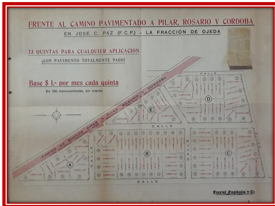
Plano de loteo.

En el plano del loteo podemos ver que las 73 quintas abarcaban 5 manzanas de forma irregular. La manzana "A" está dividida en 8 quintas, comprendida entre las actuales Av. Presidente Arturo U. Illía (Ruta Nacional Nº 8), y las calles Ventura Coll y Capitán Martínez; la manzana "B" en 24 quintas, entre las calles Ventura Coll, Gironde, Presidente Quintana y Capitán Martínez; la manzana "C" en 17 quintas, entre las calles Ventura Coll, Díaz Vélez, Presidente Quintana y Gironde; la manzana "D" en 17 quintas, entre las calles Gironde, Presidente Quintana, Díaz Vélez, Oyuela y Av. Arturo U. Illía y la manzana "E" en 7 quintas, entre las calles Presidente Quintana, Gironde y Av. Presidente Illía (Ruta Nacional Nº 8).