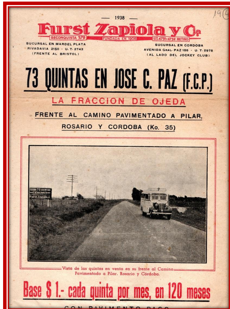
Folleto de venta de 73 quintas denominada “La Fracción de Ojeda”

aptas para cualquier aplicación y en especial para “week-end”, quintas de verano, etc.”.