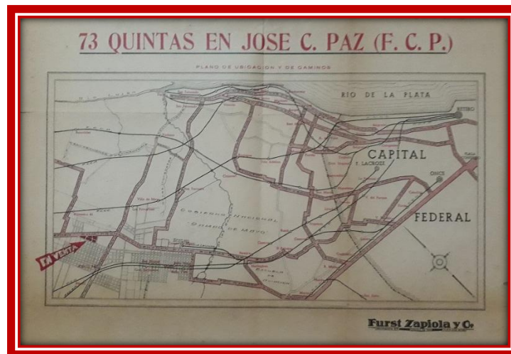
Plano de ubicación del loteo

Se informaba además, que el pavimento del Camino a Pilar estaba totalmente pago y que los alambrados no entraban en la venta.