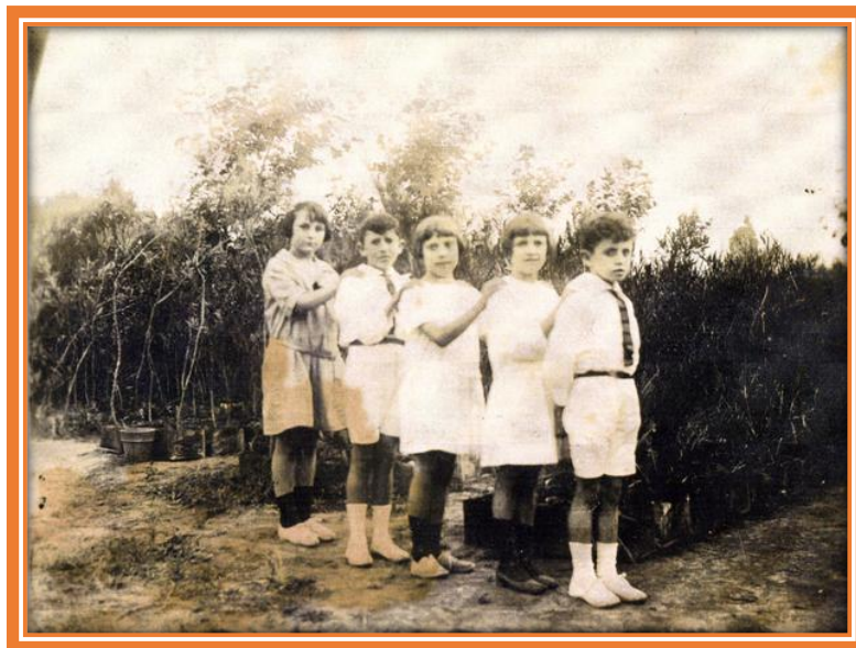
Ministerio de Agricultura (ex vivero ferroviario) sobre calle Florida (actual Héctor Arregui)

Con respecto al arreglo y cuidado de las dos plazas, en primer lugar, la Unión Vecinal asumió la atención de la Plaza “Centenario”, ya que se encontraba en “un completo estado de abandono” . El 7 de junio de 1939, ya había hecho gestiones ante el Ministerio de Agricultura, solicitando árboles para la Plaza y también para las calles de Pueblo Nuevo.