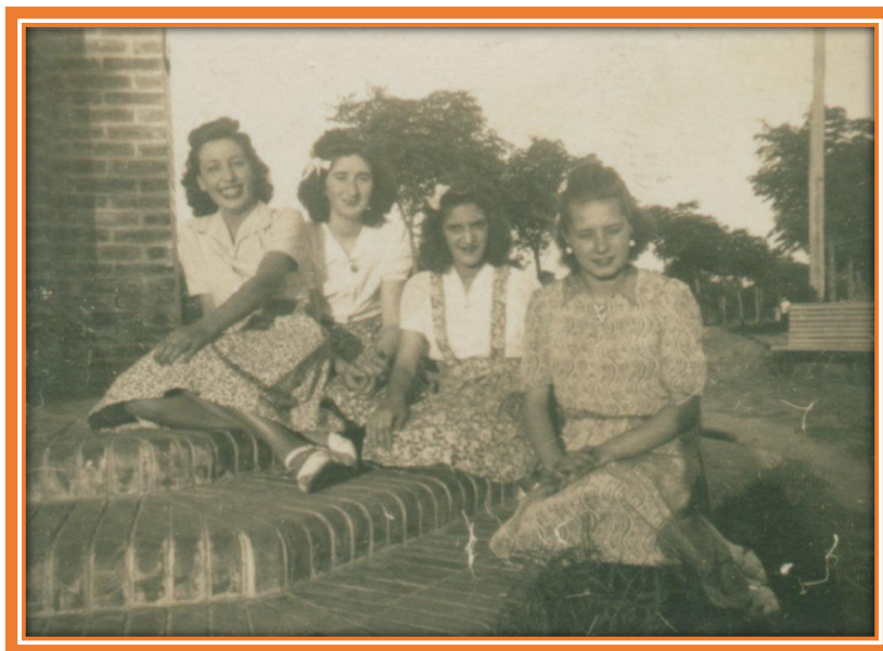
Jóvenes de "Villa Iglesias" al pie del mástil de la Plaza "Centenario"

En el centro de la Plaza se fue levantando de ladrillo cerámico a la vista el mástil, de base octogonal con tres escalones, sobre ella se levantó un pilar en forma de cruz, rematado en un cuadrado, de cuyo centro emergía el mástil.