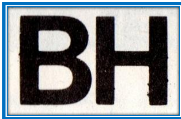
1978: Logo del Banco de Hurlingham.

El banco estaba intervenido, finalmente la Justicia de la dictadura decretó la quiebra del Banco de Hurlingham 8 .