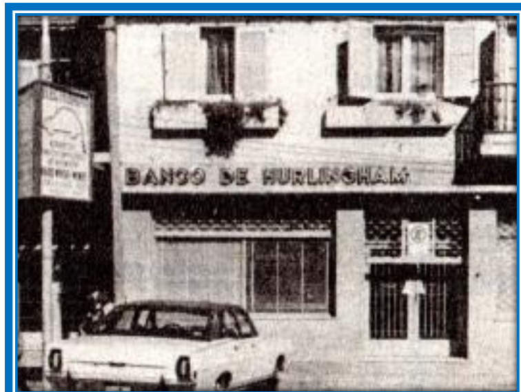
Sucursal N° 1 del Banco de Hurlingham Av. León Gallardo (actual Presidente Perón) N° 5099, José C. Paz

Las operaciones iniciales comprendían casi exclusivamente a Cuentas Corrientes y Cajas de Ahorro, el monto total de depósitos se elevaba a alrededor de seis millones de pesos moneda nacional, cifra que en esos momentos era de suma importancia, tanto por el volumen del dinero como por el signo de confianza que le dispensaron, en reciprocidad, cientos de ahorrista y clientes.