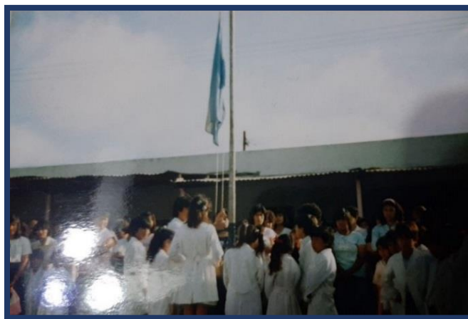
Segunda sede de la Escuela de Educación Técnica N° 3, el antiguo edificio de la E.G.B. N° 9

En febrero de 2000 la E.G.B. N° 9 se trasladó a su nuevo edificio, por lo que la Dirección de la Escuela de Educación Técnica N° 3 solicitó la autorización para trasladar la escuela al viejo edificio desocupado de la E.G.B. N° 9. La mudanza se realizó con la colaboración de profesores, padres y alumnos comenzando el ciclo lectivo 2000 en el Barrio Mirador de Altube