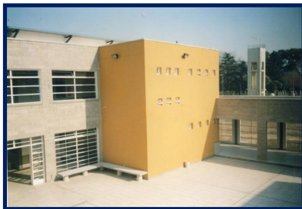
Vista del edificio escolar

De la reseña histórica institucional extraemos que “Luego del receso invernal se recibe el edificio terminado y toda la comunidad educativa comenzó la ardua tarea de la mudanza. Mucho trabajo: limpieza general, acondicionamiento de las aulas y de los espacios para el personal. Pero nada empañaba la alegría de ocupar edificio propio, nuevo, iluminado, amplio y confortable... A partir de ese momento la técnica comenzó a transitar su vida institucional y se vivieron muchísimas experiencias que construyeron su historia y su ADN” .