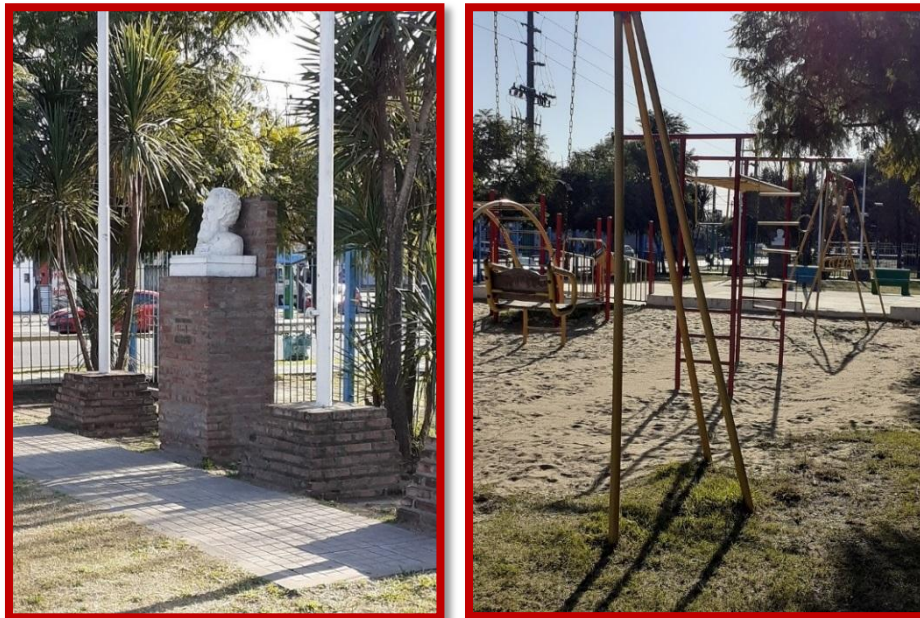
La Plaza en la actualidad

En el transcurso del tiempo, la plaza fue cercada con rejas y se construyó un parque infantil, al que a diario concurren las familias para que jueguen sus hijos, mientras los padres charlan compartiendo un mate.