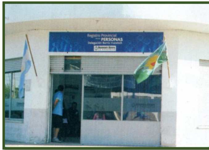
Delegación Vucetich del Registro Civil

La revista publicada por la Municipalidad de José C. Paz en el año 2009, titulada “1999 – 10 años de crecimiento – 2009”, dedica dos páginas a las reparticiones oficiales inauguradas en ese tiempo: ANSES, PAMI, Juzgado de Paz y en lo referente a la Delegación del Registro Civil en el Barrio Vucetich expresa: “El registro civil es la institución que constantemente visitan los vecinos para los acontecimientos más importantes de un ciudadano, ya que concurre a anotar el aumento de la familia a través del nacimiento de sus hijos o la formalización de los documentos de identidad, la unión en matrimonio o el deceso de un integrante de la misma. A raíz del crecimiento poblacional los nuevos registros son recibidos con beneplácito por los vecinos”.