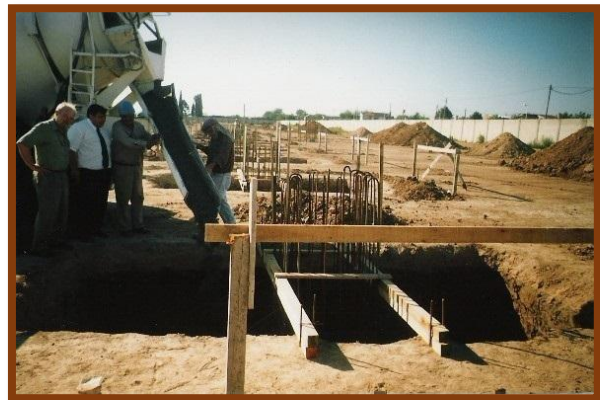
Movimiento de tierra y llenado de bases