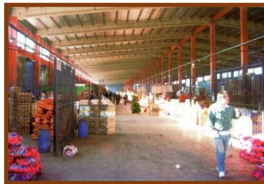
Interior de las Naves 1 y 2