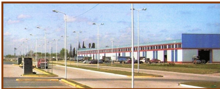
Nave 2 – Productos fruto-hortícolas

En la revista publicada por la Municipalidad de José C. Paz en el año 2009, titulada “1999 – 10 años de crecimiento – 2009”, le dedica dos páginas al Mercado Concentrador expresando “Emprendimiento ejemplo de un gobierno comprometido en dignificar al pueblo con trabajo genuino, se encuentra en pleno funcionamiento el paseo de compras y la nave fruto-hortícola y está en etapa de finalización la tercera nave... Logrará con la puesta en funcionamiento de la totalidad del complejo generar directa e indirectamente más de 20.000 puestos de trabajo...”