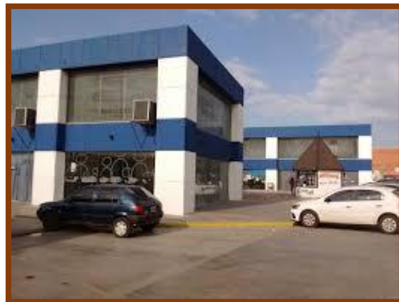
Inauguración del CDR de José C. Paz y vista del edificio