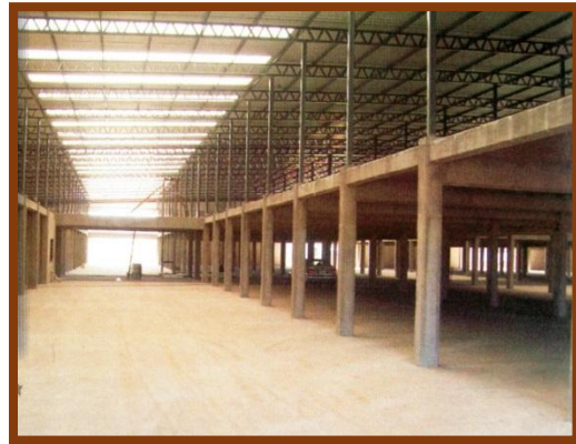
Acceso al Mercado Concentrador e interior de la Nave 1

En la revista publicada por la Municipalidad de José C. Paz en el año 2005, con el título “Cinco años de obras que cambiaron un Distrito” , en sus páginas 21 y 22 presenta fotografías que muestran el avance de las obras expresando “Producto de la crisis sufrida por el país durante los últimos años, agravaron las condiciones de producción y comercialización de bienes, el Mercado Concentrador está llamado a ser un polo de desarrollo comercial en toda la región... La zona de