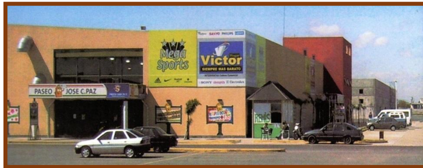
Nave 1: Paseo de compras