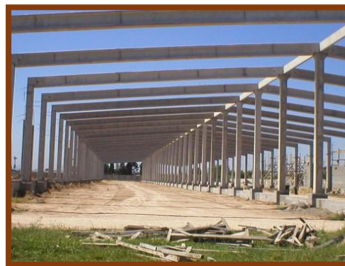
Nave 2 destinada a la venta de la producción fruto-hortícola

En la revista publicada por la Municipalidad de José C. Paz en el año 2007, titulada “José C. Paz un pueblo de trabajo”, en su interior le dedica dos páginas expresando “El Mercado Concentrador es el mayor complejo comercial construido en la región, este emprendimiento da empleo a miles de paceños”, donde podemos apreciar cinco fotografías que ya lo muestran terminado y en actividad.