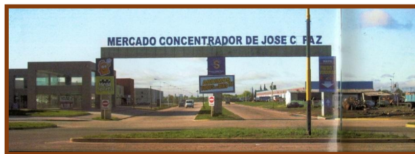
Ingreso al Mercado Concentrador

En la revista publicada por la Municipalidad de José C. Paz en el año 2007, titulada “José C. Paz un pueblo de trabajo”, en su interior le dedica dos páginas expresando “El Mercado Concentrador es el mayor complejo comercial construido en la región, este emprendimiento da empleo a miles de paceños”, donde podemos apreciar cinco fotografías que ya lo muestran terminado y en actividad.