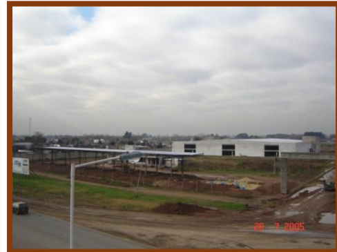
Interior Nave 1 – Estación de servicio y detrás exterior Nave 1