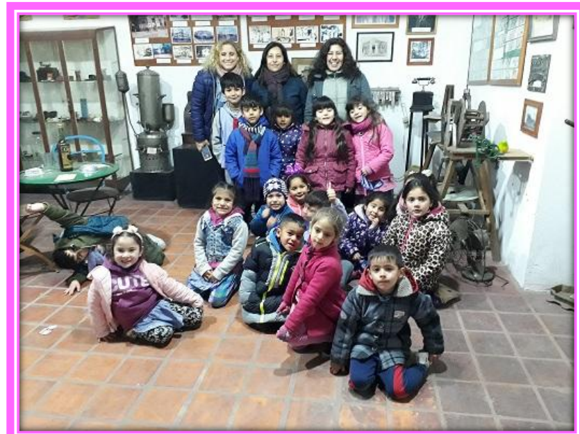
14 de agosto de 2019, el Jardín 904 visita el Museo de José C. Paz