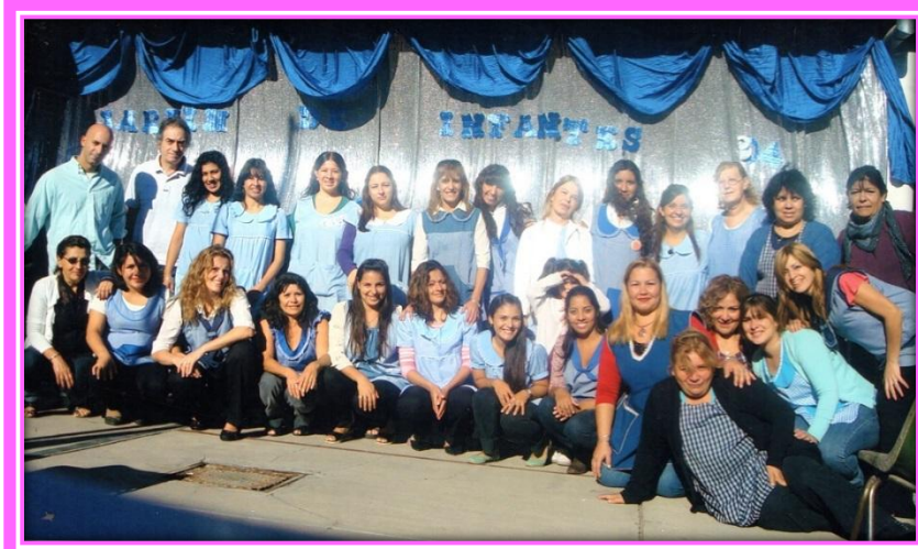
Personal del Jardín de Infantes N° 904 el 30 de marzo de 2011