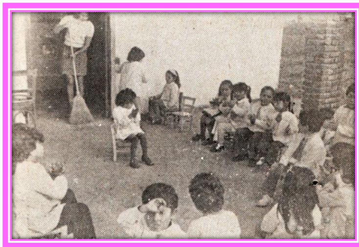
Jardín de Infantes de la Capilla "Santa Cecilia"

En 1981, el Jardín de la Capilla "Santa Cecilia" funcionaba con cuatro salas, dos en el turno mañana y dos en el turno tarde.