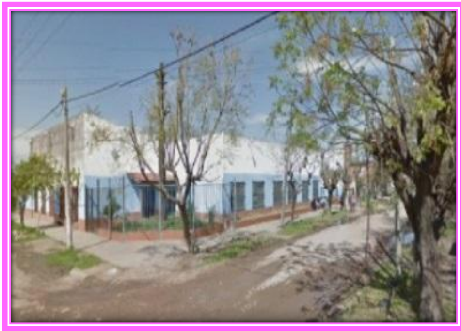
Jardín de Infantes N° 904 (septiembre de 2014)

Al año siguiente, en 1989, dada la capacidad del edificio, el Jardín N° 918 inició el ciclo lectivo con 12 salas, seis en el turno mañana y seis en el turno tarde, ampliándose la planta funcional.