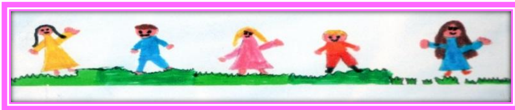
Dibujo de los alumnos del Jardín para las invitaciones al acto de imposición del nombre del Jardín

En el año 2009, al celebrar el Jardín sus 25 años de vida, se implementó el Proyecto “Nuestro Nombre”, para elegir un nombre propio para el Jardín. Después de un proceso democrático resultó electo el de “Domingo Faustino Sarmiento”, realizándose la ceremonia de imposición del nombre el 30 de marzo de 2011 3 .