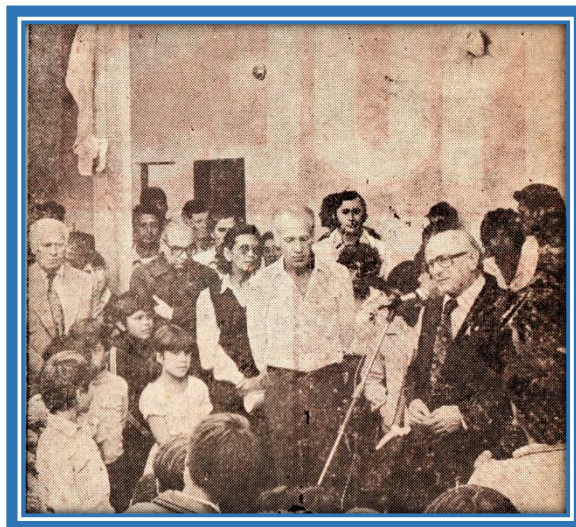
4 de abril de 1982: Entrega del edificio escolar

El 8 de agosto de 1983, inició sus actividades la Escuela N° 65 de General Sarmiento, actual Escuela Primaria N° 19 de José C. Paz, en un edificio construido por la Sociedad de Fomento del Barrio San Gabriel, ubicado en las calles Defensa y Colón de dicho barrio.