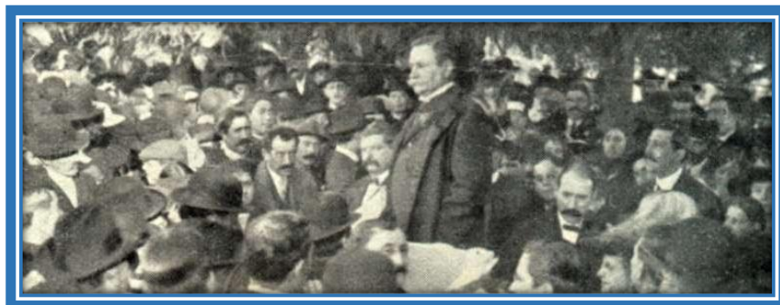
Estanislao Severo Zeballos en José C. Paz el 13 de julio de 1913 cuando se cambió el nombre de “Arroyo Pinazo” por el de “José C. Paz” a nuestra localidad

ESTANISLAO SEVERO ZEBALLOS (Rosario, Santa Fe, 1854 – Liverpool, Inglaterra, 1923 Escritor, legislador y diplomático.