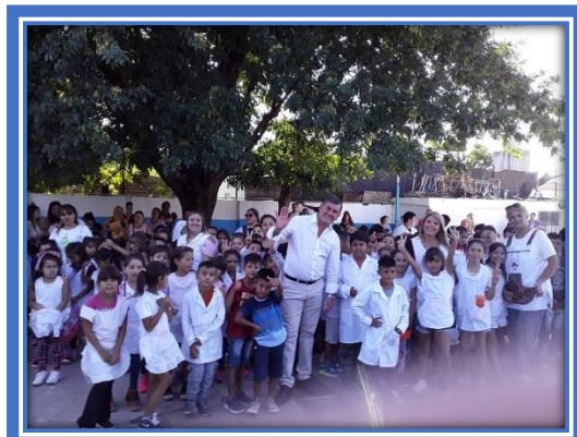
Acto de inicio del Ciclo Lectivo 2020

La Escuela Primaria N° 32 de José C. Paz, ex Escuela Primaria N° 102 del Partido de General Sarmiento, fue creada con el nombre de “Gregorio de Laferrere”. Presentamos su biografía publicada por Página 12 en el “ Diccionario ”.