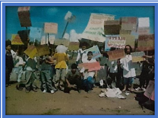
Alumnos y docentes movilizados por la erradicación del basural