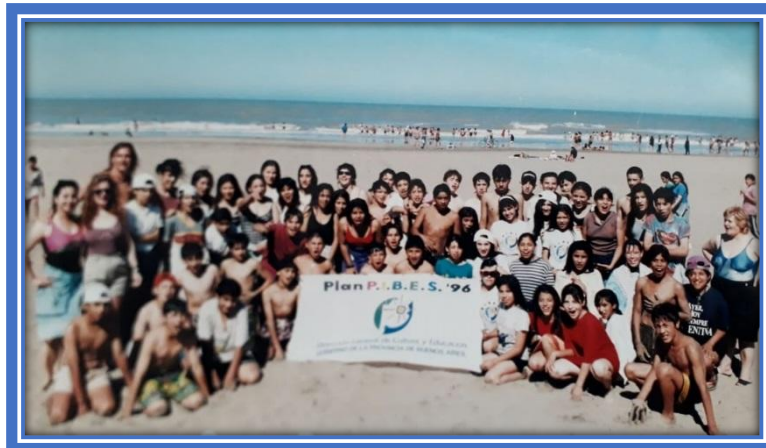
1996: Alumnos en Mar del Plata participando del Plan P.I.B.E.S.

cambiando la terminología “grado” por “año”, y paulatinamente se incorporaron 8º año (1997) y 9º año (1998).