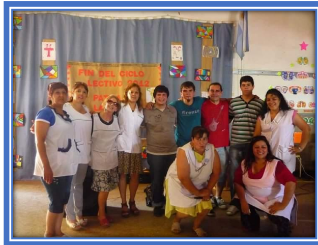
Cierre Ciclo Lectivo 2012