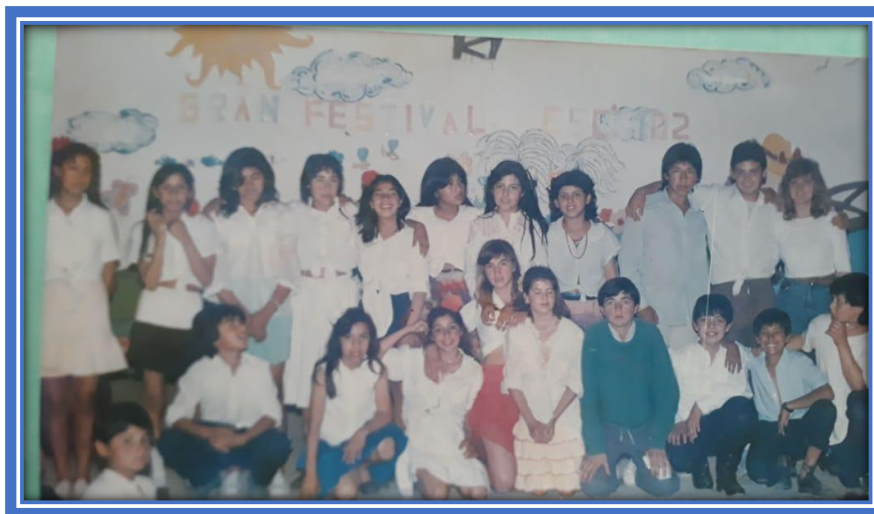
Alumnos de 2° grado de 1985 egresando de 7° grado en 1990