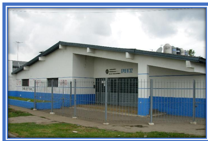
Escuela N° 102, actual Escuela Primaria N° 32