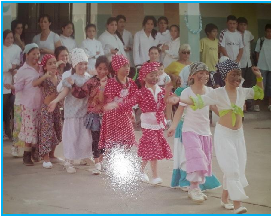
2010: Acto del Bicentenario de la Revolución de Mayo