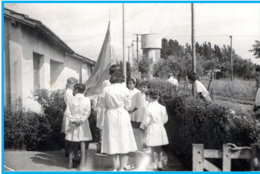
Izamiento de la bandera