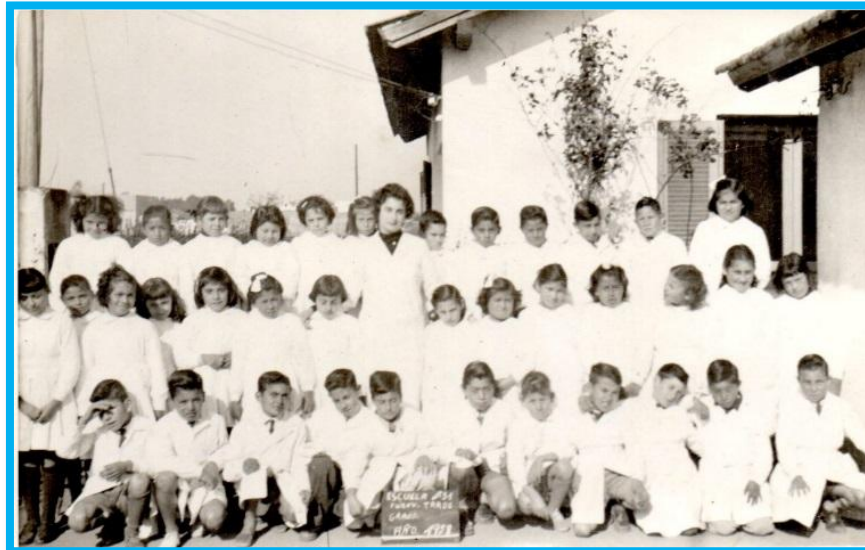
Alumnos en el frente de la Escuela (casa N° 67)