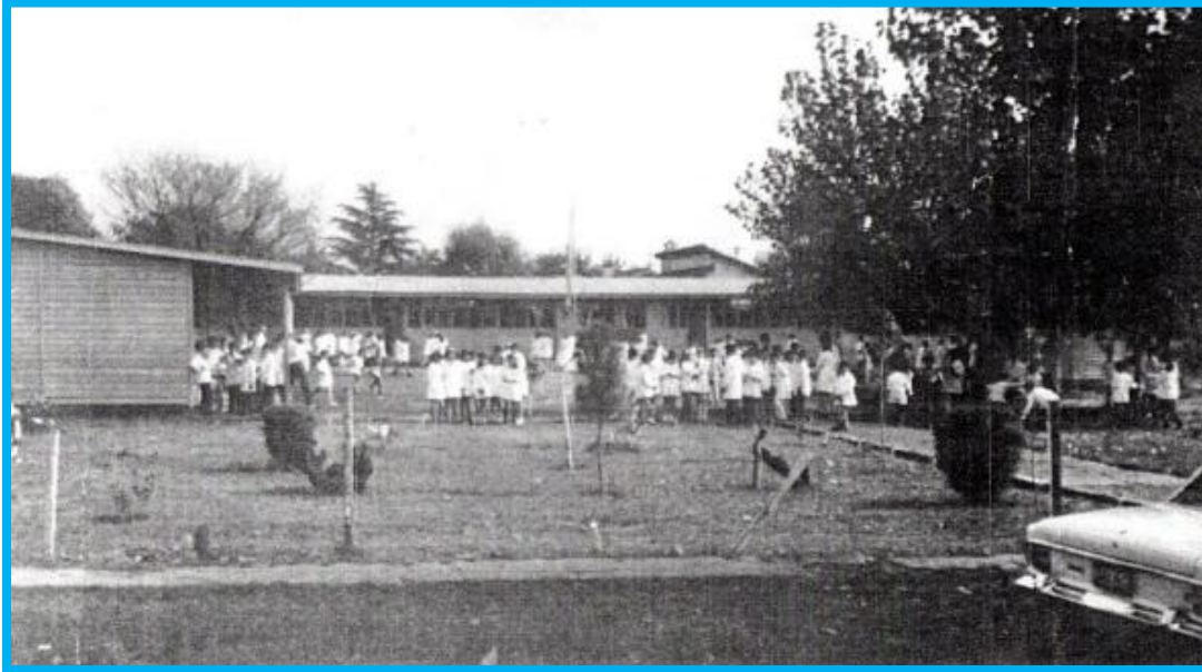
Nuevo edificio escolar en Serrano esquina Pasaje Carlos Tejedor

Para entonces la escuela se había mudado al predio ubicado en la esquina de Serrano y actual Pasaje Carlos Tejedor.