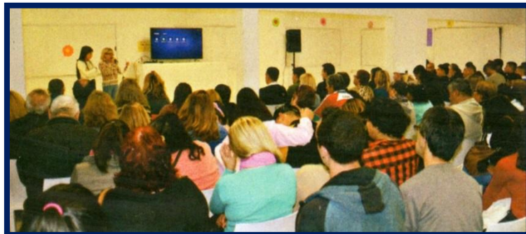
Julio 2019: Acto de altas terapéuticas

informaba que “En el Hospital recibieron el alta terapéutica 10 nuevos pacientes. De esta manera se concreta un total de 108 ciudadanos, de diferentes localidades y del exitoso trabajo que lleva adelante la administración del nosocomio desde que abrió sus puertas el 4 de agosto de 2017. Este centro multidisciplinario, construidos con fondos compartidos y finalizado en la gestión del intendente Mario Ishii, por empleados de la Constructora Municipal, dentro de la provincia de Buenos Aires, es el único contemplado para la Comunidad Terapéutica brindando servicios totalmente gratuitos” 5 .