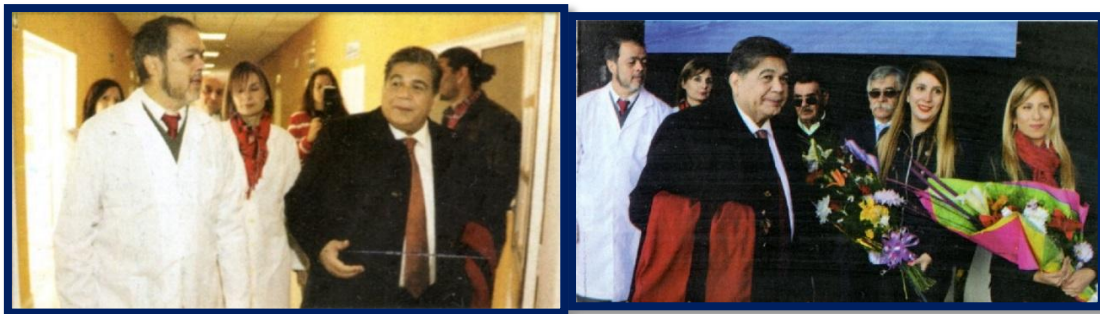
Autoridades y familiares recorriendo las instalaciones

La revista Buenas Noticias! 3 informaba que este nosocomio “ cuenta con 18 camas de internación, sala de estar, cocina y comedor, una radio que se utilizará como herramienta ocupacional de terapia... ” Nosocomio que está destinado “ para pacientes a partir los 18 años de edad... ”