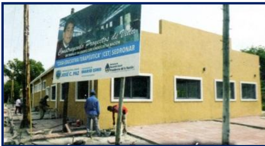
Hospital Mental, Terapéutico y Adicciones en construcción