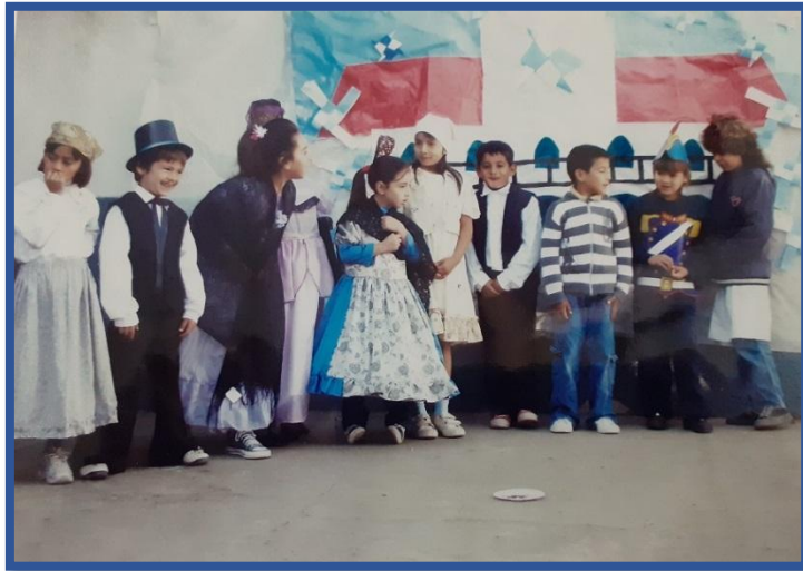
2009/2010: Actividades desarrolladas durante la implementación del proyecto “Identidad Cultural”