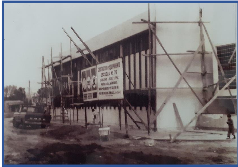
Edificio en construcción de la EP N° 24, ex Escuela N° 78