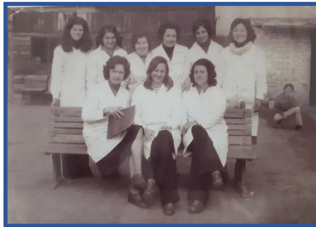
Docentes en el primer edificio escolar