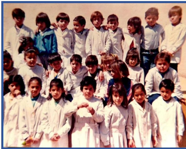
1992: alumnos de 1° “E” del turno intermedio