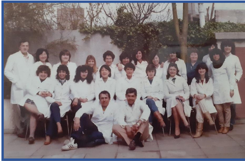
Personal directivo y docente de los años 90